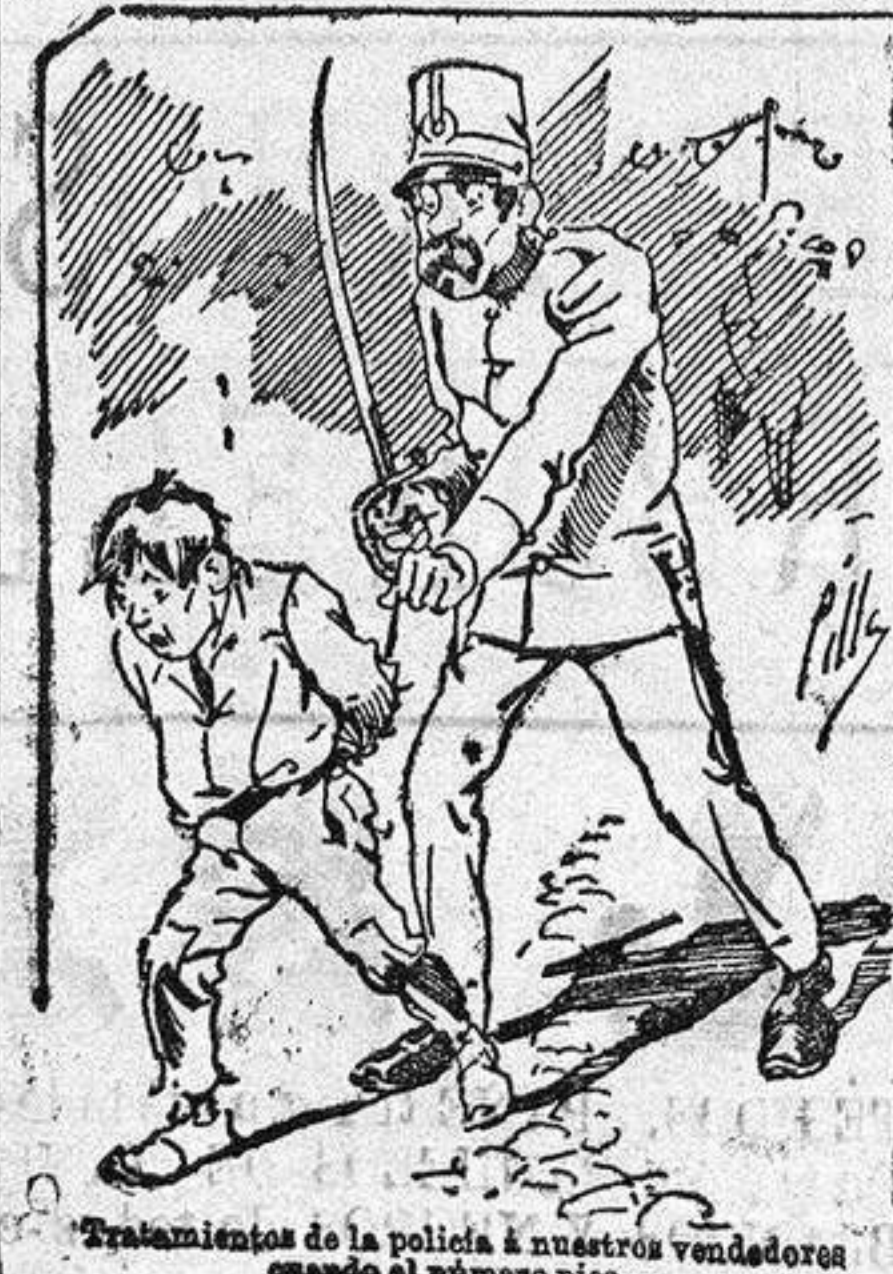
Tratamiento de la policía á nuestros vendedores cuando el número pica...

Abominan á nuestros libros..., pero los compran. con sólo indicar el nombre y dirección del que lo desea en sobre dirigido al Sr. Administrador de