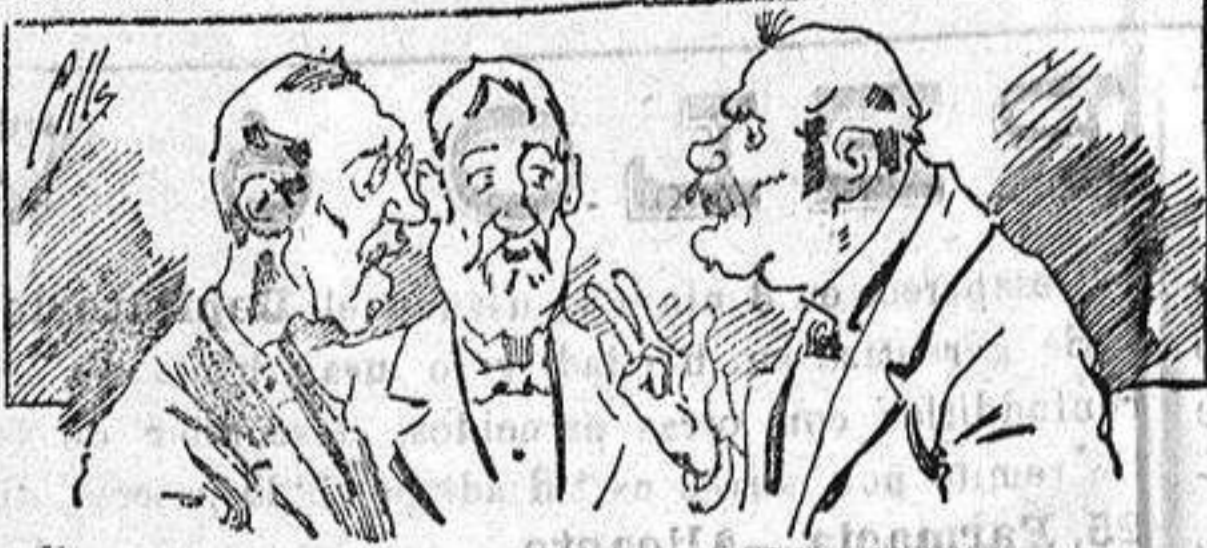
Abominan á nuestros libros..... pero los compran.

Todas las personas de gusto, curiosas é ilustradas deben pedir al Director de LA AVISPA, apartado núm. 8, MADRID, un ejemplar que se remite gratis y franqueado. Esta Revista Enciclopédica Popular publica recreaciones científicas, recetas de cocina, repostería, confitería, vinos, licores, pinturas, barnices, betunes y cuantas noticias y conocimientos puedan ser beneficiosos. Cuenta además con buenos grabados, parte literaria excelente; da regalos mensuales á sus lectores con la Lotería Nacional y participaciones en la misma, á cuyo efecto compra todos los sorteos, y en una de las Administraciones más afortunadas por la suerte, billetes enteros. La suscripción y los números que se nos pidan se sirven gratuitamente á correo vuelto y franqueados, con sólo indicar el nombre y dirección del que lo desea en sobre dirigido al Sr. Administrador de