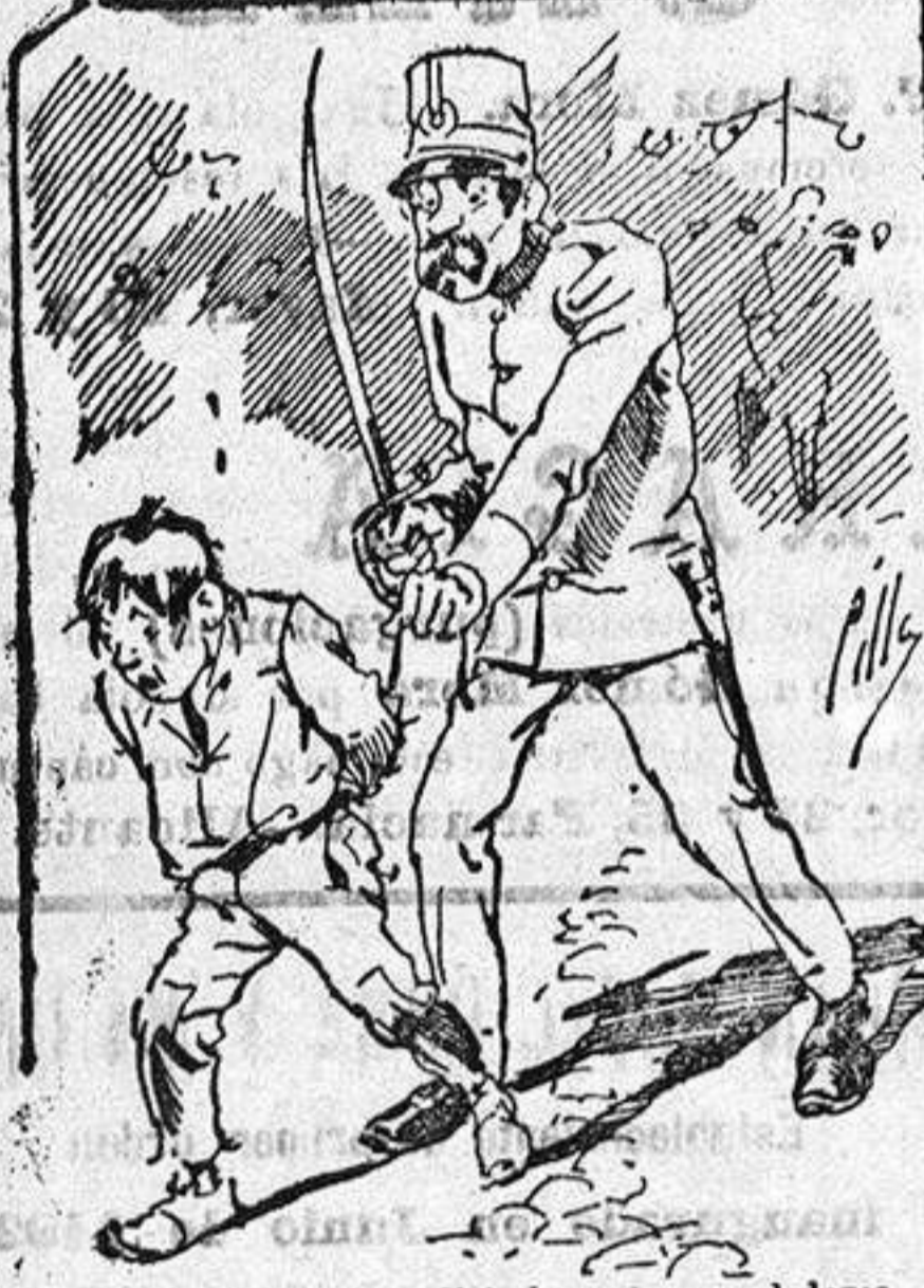
Tratamientos de la policía á nuestros vendedores cuando el número pica.....

También puede pedirse LA AVISPA y el CATALOGO RESERVADO en casa de nuestros corresponsales autorizados, si no se quiere escribir á la Administración.