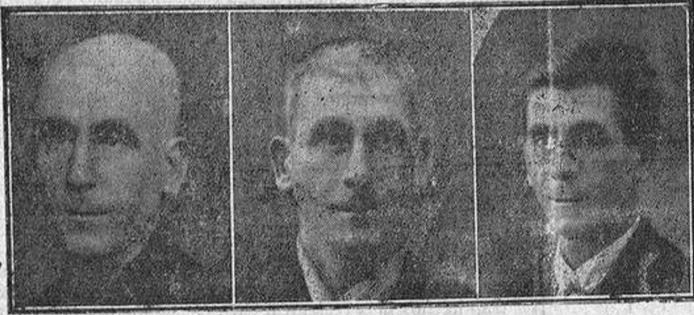
La misma persona antes y después

Revelación sensacional—El rejuvenecimiento de la fisonomía humana