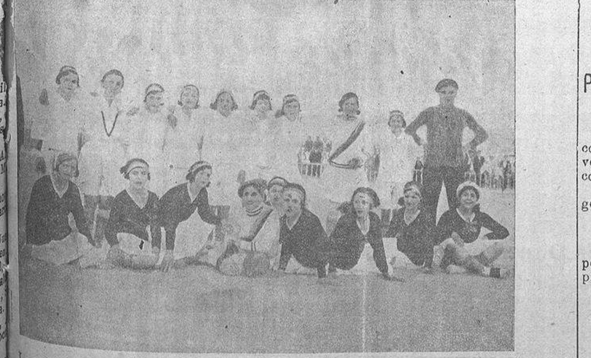
Los equipos de señoritas del Valencia F. C. y España F. C. de Valencia que mañana jugarán en el Plá