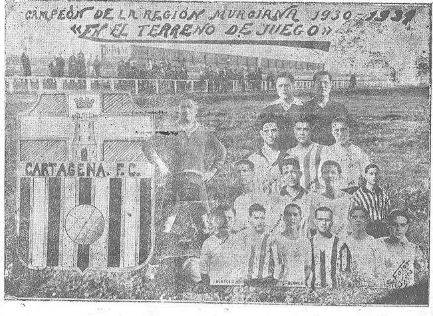
El potente equipo del Cartagena F. C. que el próximo domingo podemos presentciar en el campo del Plá, contendiendo con el Alicante F. C.