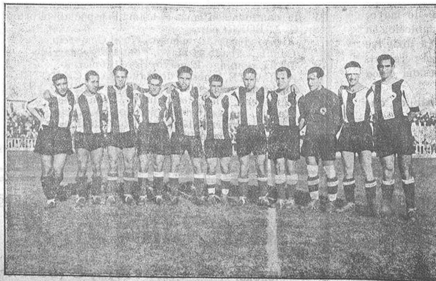
El Hércules F. C., que ayer venció al Murcia por 1 a 0