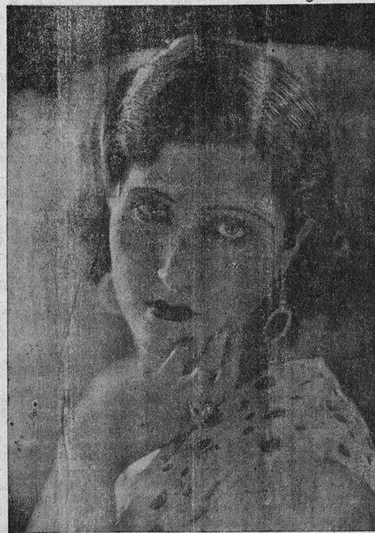
LA LINDA ARTISTA ESTRELLITA CASTRO, DE LA COMPAÑIA RAMPER, QUE ESTÁ OBTENIENDO UN SEÑALADO Y MERCEDADO ÉXITO EN EL PRINCIPAL

Visite Vd. las oficinas Gas Alicante pida presupuesto de instalaciones