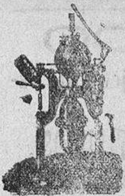
Máquina para hacer gaseosas