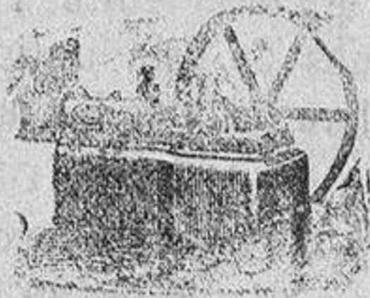
Máquina de vapor locomovil

Catálogos gratis y francoos á quien los pida.