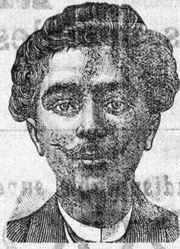
Después de 15 días de tratamiento