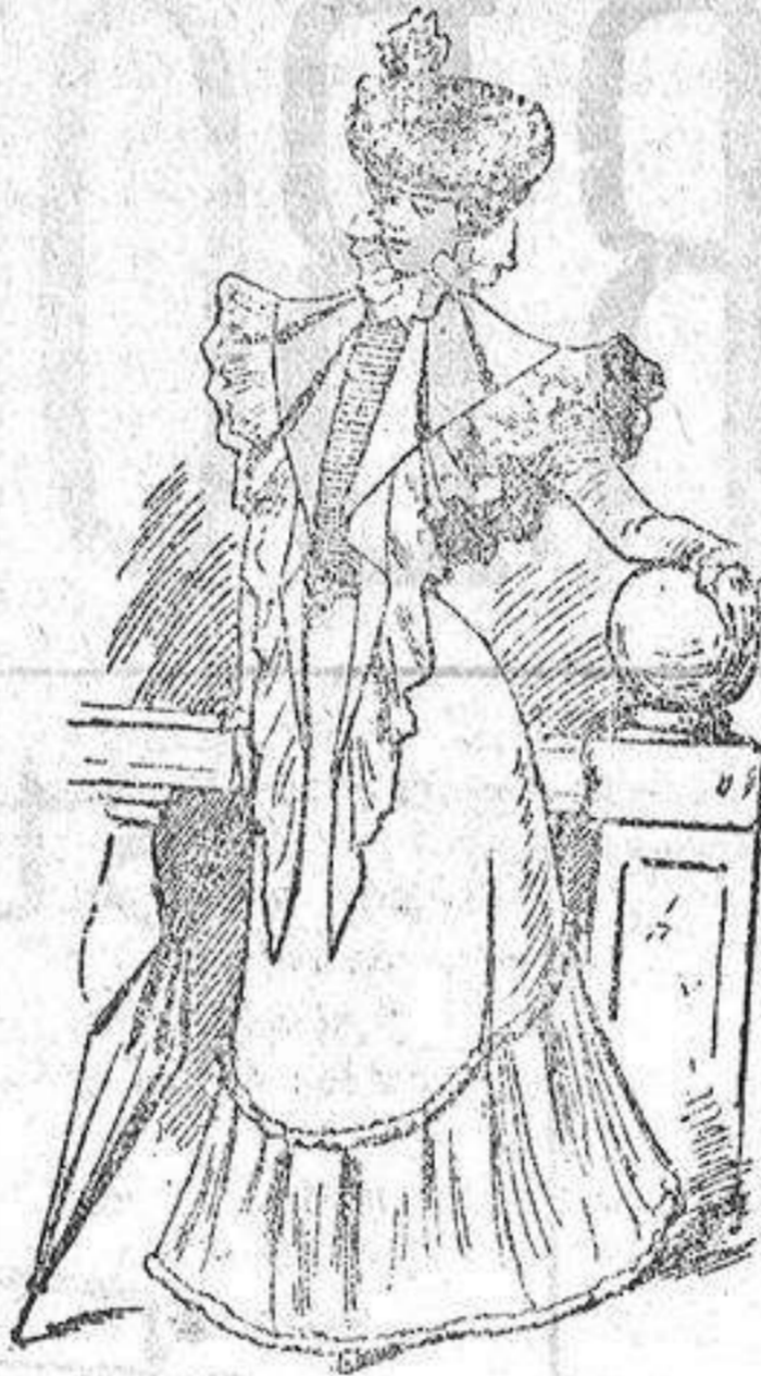
Manteleta para señorita

Modelos exclusivos para nuestras lectoras, de los grandes almacenes de "El Siglo."