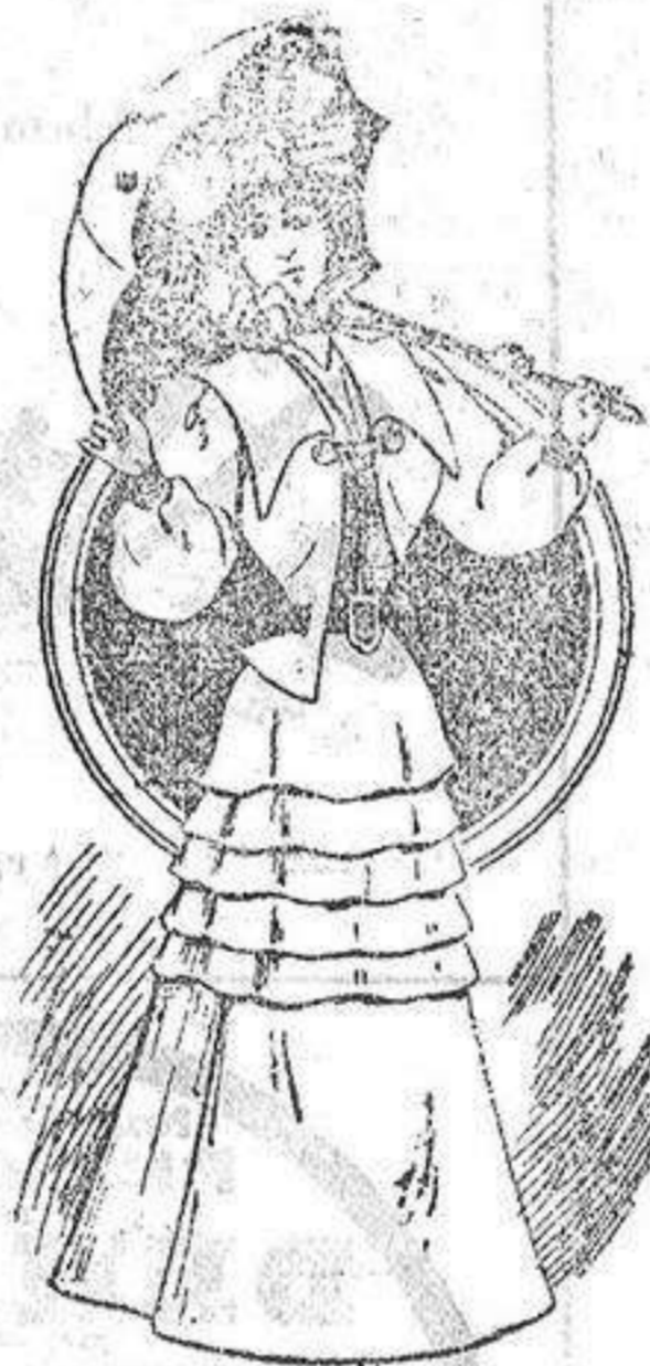
Traje para primavera

De moaré fasconé, adornado de tiras de azabache que cubren las costuras, con la espalda de una pieza. Esta manteleta va abierta en el delantero y lleva un volante de gasa alrededor, con cuello de lo mismo.