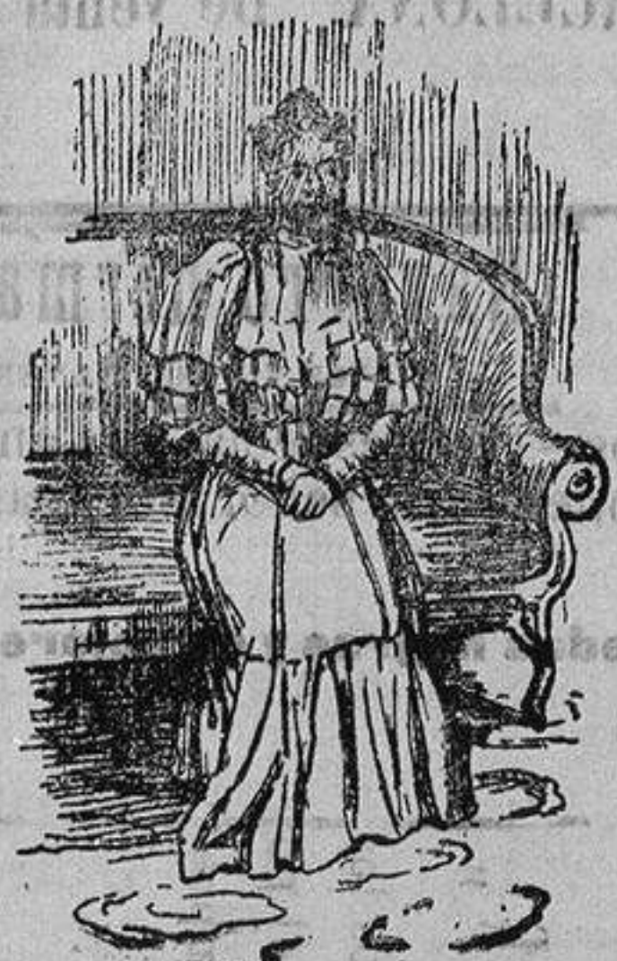
La reina Ranavaloa

Esta reina infortunada que desde 1885 en que se estableció en Madagascar el protectorado francés, pero principalmente desde Febrero de 1897 en que la destronaron, desterrándola á la isla Reunión, tanto ha llamado la atención de los franceses, hállase actualmente en París, viviendo modestamente de la pensión que el Gobierno francés, con cargo al presupuesto de Madagascar, la tiene asignada.