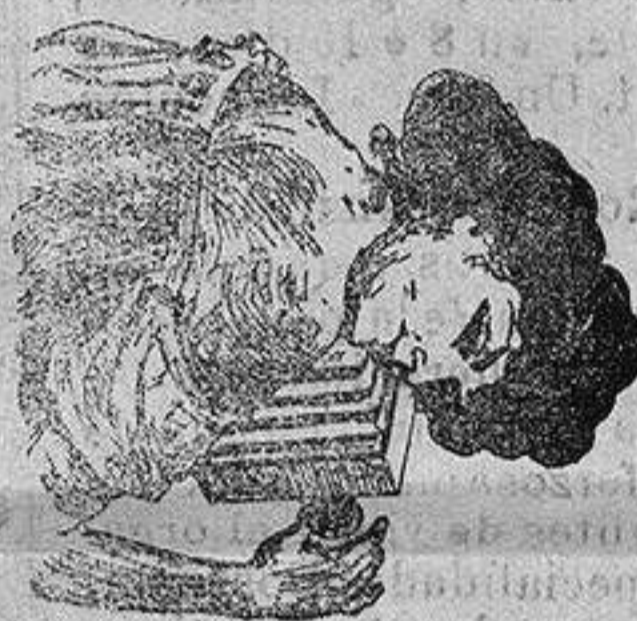
RAMON F. Y TOMAS

NOTA.—Se admiten pequeñas cantidades semanales.