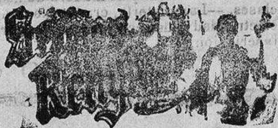
Santo de hoy: San Gabino Santo de mañana: San Nemesio

Se admiten esquelas de defunción a precios convencionales hasta las seis de la tarde y seis de la mañana.