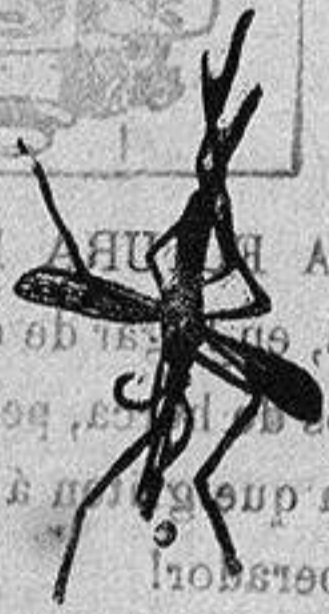
ANOFELE Mosquito que pro paga la fiebre palúdica

Rogamos a los se ñores Doctores, que lo ensayen en los ca sos que resultaron in curables con cualquier otro tratamiento, con la seguridad de que después no lo aban donarán nunca.