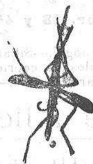
ANOFELE Mosquito que propaga la fiebre palúdica