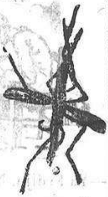
ANOFELE Mosquito que propaga la fiebre palúdica