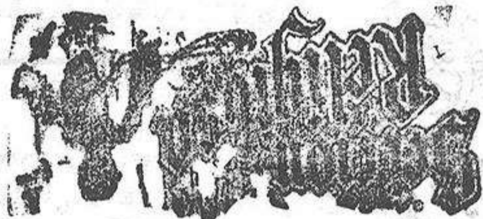
Santo de hoy: Santa María Cervellón. Santo de mañana: San Cipriano

Han dado principio los populares «Viernes» y «Sábado», con saldos, retales y gangas á la cuarta parte de su valor.