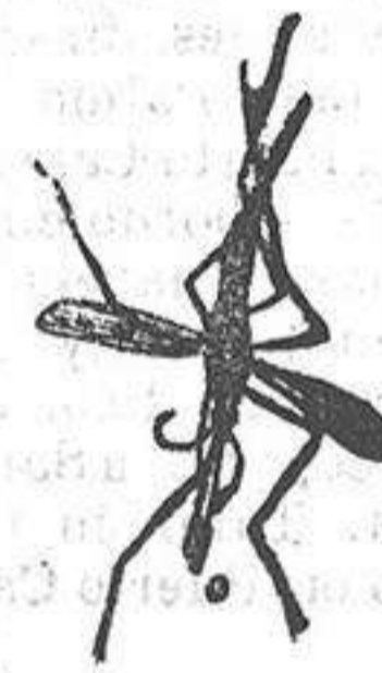
ANOFELE Mosquito que propaga la fiebre palúdica