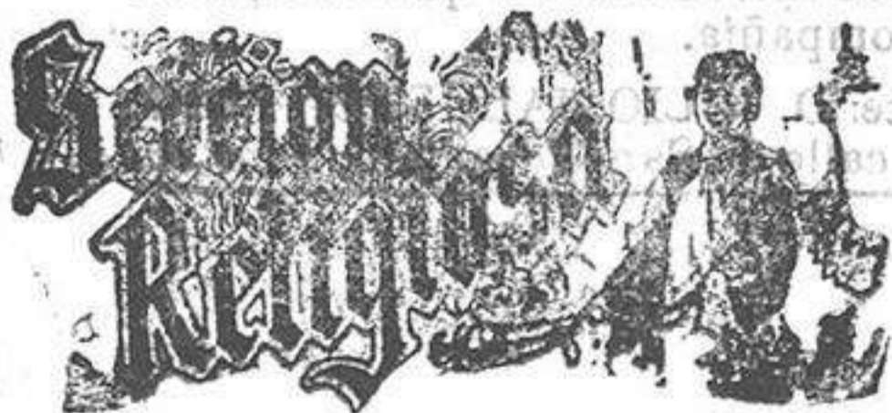
Santo de hoy: San Nereo Santo de mañana: San Pedro

La galería de pintura, que ocupa el primer piso, está á la altura de las mejores de Europa.