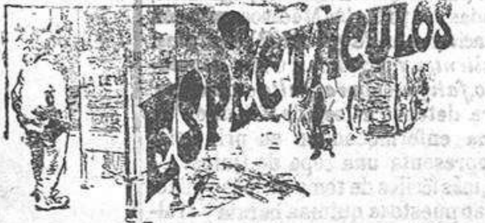
Salón Novedades Función por secciones hasta las do-

ce de la noche. Variado programa cinematográfico. Precios: Preferencia 20 céntimos. Entrada general, 10 id.