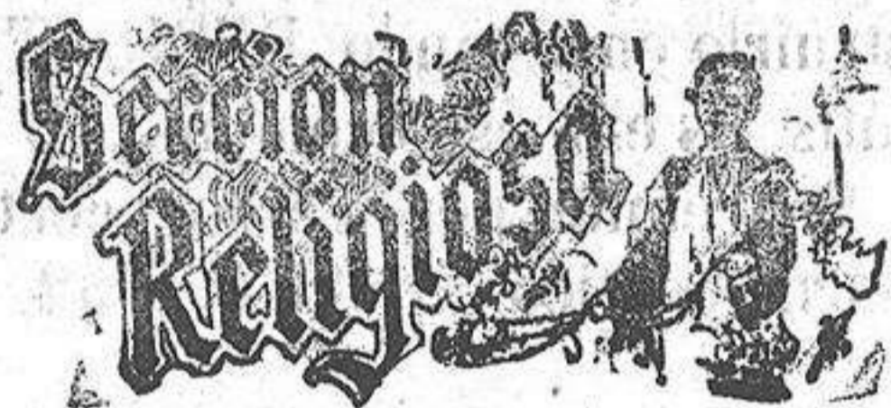
Santo de hoy: El Angel de la Guarda. Santo de mañana: San Simplicio

Asombroso es, en verdad, la gran liquidación que de todos los géneros de invierno, hace el conocido establecimiento de tegidos EL SIGLO, desde el 18 de Enero, por fin de temporada, y como siempre, desde este día, sus tan renombrados VIERNES y SABADOS dan principio con sus retales y saldos, casi regalados.