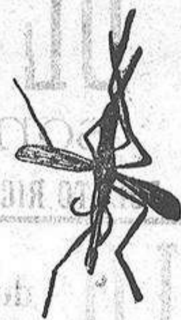
ANOFELE Mosquito que pro-paga la fiebre palúdica.

Rogamos á los se-ñores Doctores, que lo ensayen en los ca-sos que resultaron in-curables con cual-quier otro trata-miento, con la segu-ridad de que después no lo abandonarán nunca.