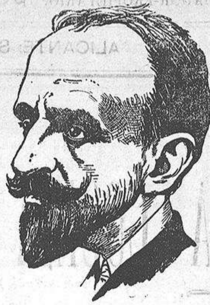
El Dr. Juan Charcot

El doctor Charcot, es médico, literato y explorador; esto basta para comprender que está siempre ocupado, y que, hombre de su época, nada le arredra en cuanto á procurarse la existencia por medio del trabajo.