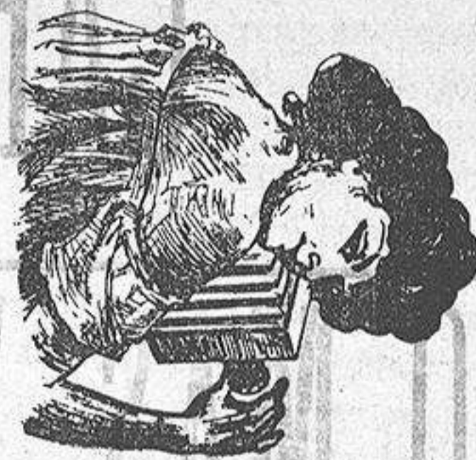
MIRAR, SI BARRERON

Por procedimientos especiales se consiguen fotografías de gran nitidez y belleza, para la reproducción de tarjetas, invitaciones, postales, álbumes, certificados, etc., con gran rapidez y á precios muy moderados.