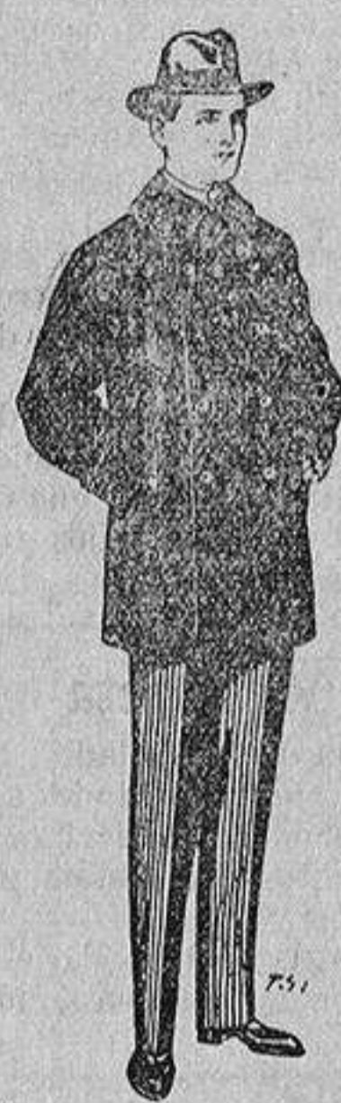
Pellizas con cuello y bocamangas de astrakan De 11 a 40 ptas

SECCIONES: Peletería, Camisería, Géneros de Punto, Corbatería, Guantería, Sombrerería, Zapatería, Paraguas, Bastones y Artículos de Viaje.