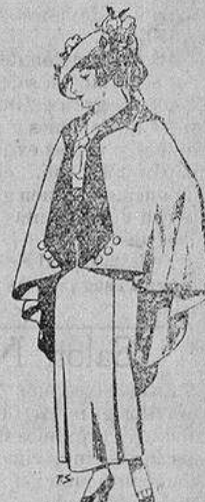
Capas de lana para jovencitas de 13 a 16 años A 25 pesetas