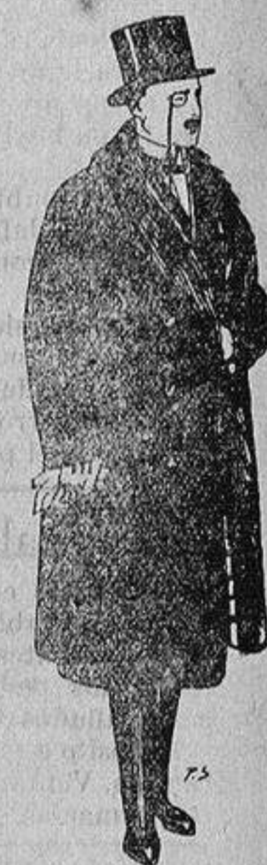
Gabanes de edredón negro, forro seda, cuello y vistas de piel a 125 ptas.