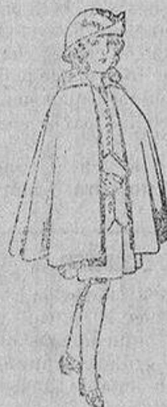
Capas de lana para niñas de 4 a 12 años De 20 a 22 ptas.