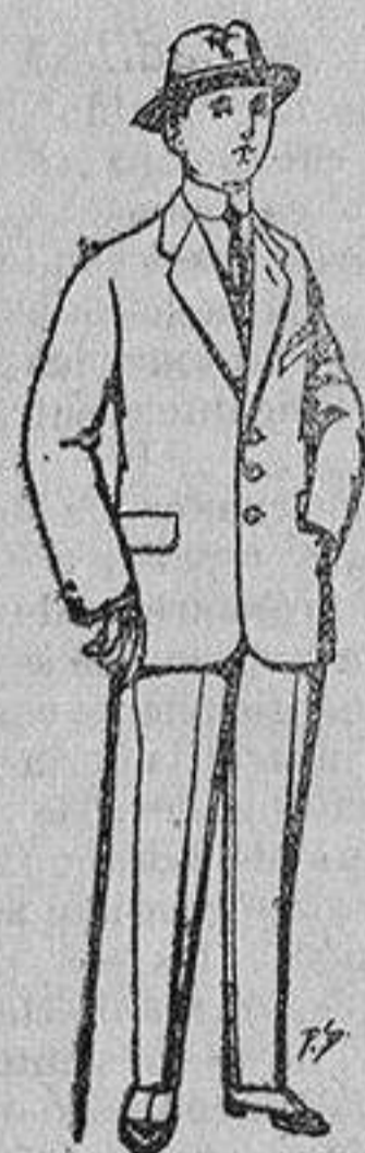
Trajes de paten, vicuña, etc., para niños de 10 a 16 años De 13 a 48 ptas.