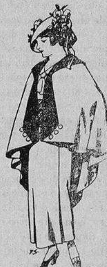
Capas de lana par jovencitas de 13 a 16 años A 25 pesetas

Ropas confeccionadas para Caballero, Señora, Niño y Niña