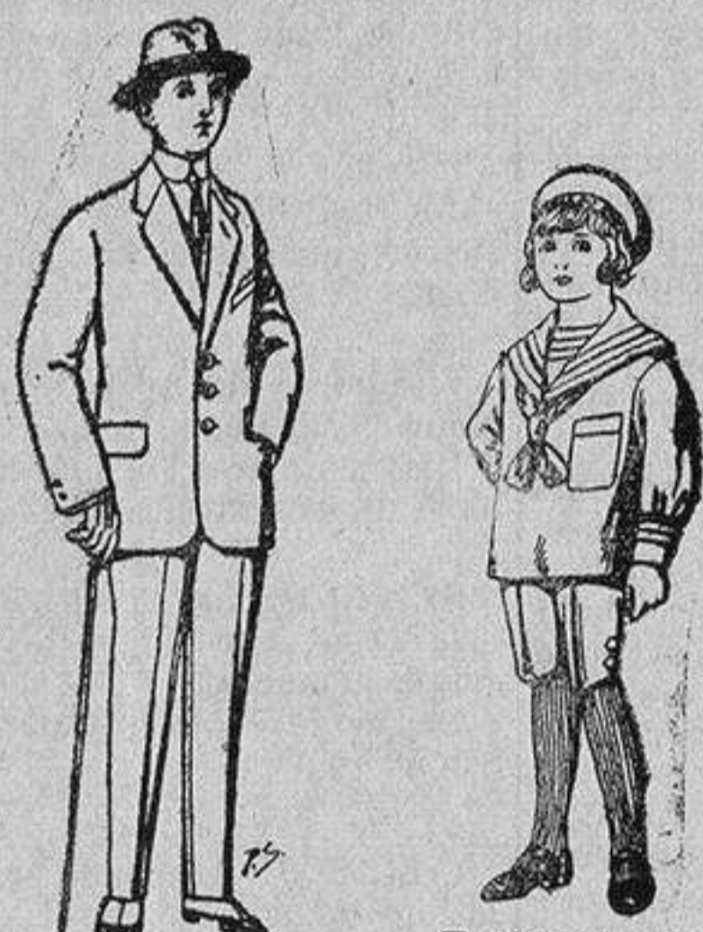
Trajes de patén, vicuña, etc., para niños de 10 a 16 años De 13 a 48 ptas.