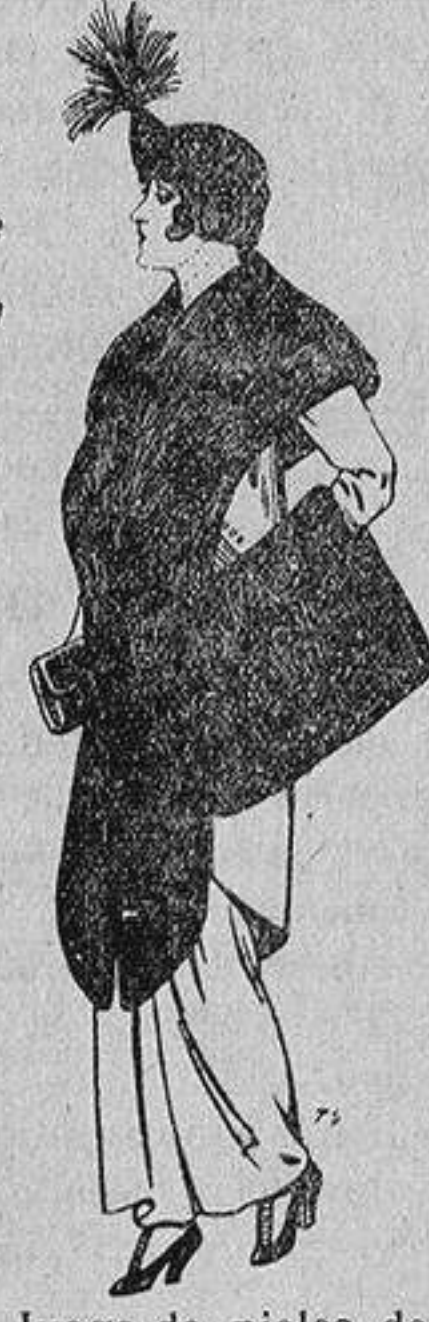
Juego de pieles de loutre de Nord para Señora 145 ptas.

Ropas confeccionadas para Caballero, Señora, Niño y Niña