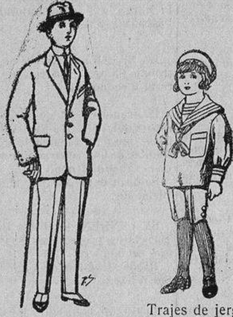
Trajes de paten, vicuña, etc., para niños de 10 a 16 años De 13 a 48 ptas.