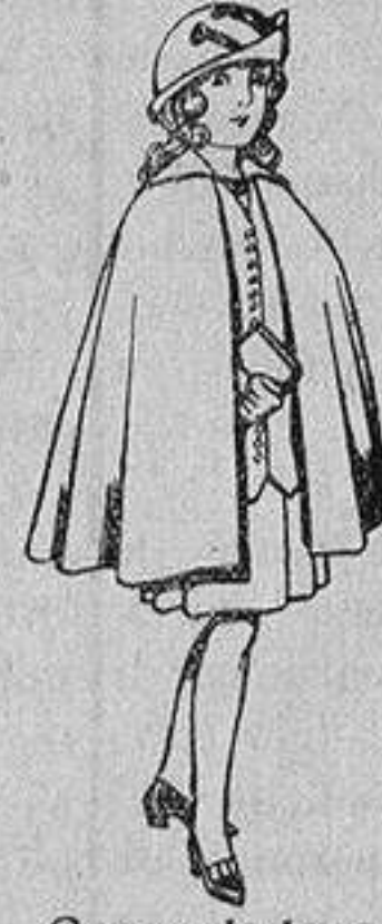
Capas de lana para niñas de 4 a 12 años De 20 a 22 ptas.