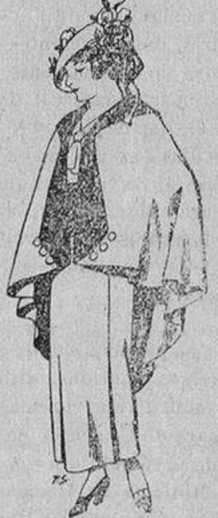
Capas de lana par jovencitas de 13 a 16 años A 25 pesetas

SECCIONES: Peletería, Camisería, Géneros de Punto, Corbatería, Guantería, Sombrerería, Zapatería, Paraguas, Bastones y Artículos de Viaje.