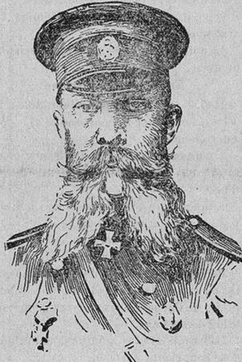
General GRIPPENBERG, gobernador del Cáucaso y generalísimo de las tropas rusas que han invadido la Turquía asiática