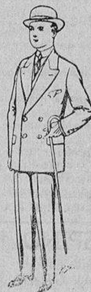
Trajes de patén, vicuña etc., para niños de 10 a 16 años De 25 a 48 pesetas.