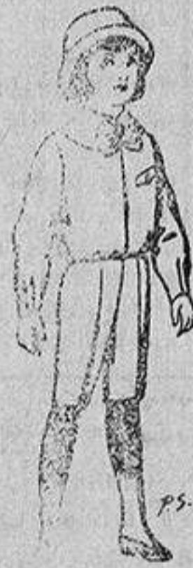
Trajes patén para niños de 4 a 9 años De 5 a 5'50 ptas.

SECCIONES: Peletería, Camisería, Géneros de Punto, Corbatería, Guantería, Sombrerería, Zapatería, Paraguas, Bastones y Artículos de Viaje.