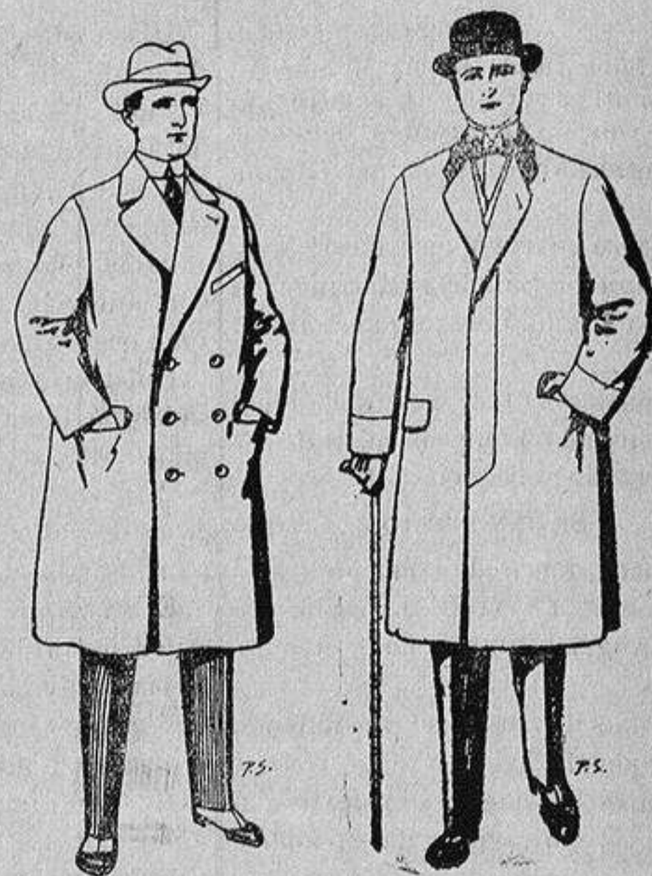
Gabanes de patén y cheviot 55 a 105 ptas. Gabanes de patén melton y cheviot De 25 a 100 ptas.