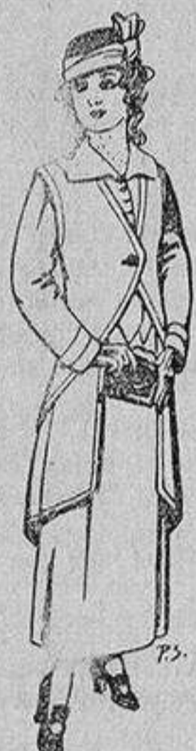
Trajes de lanilla para jovencitas de 13 a 16 años De 40 a 45 ptas.