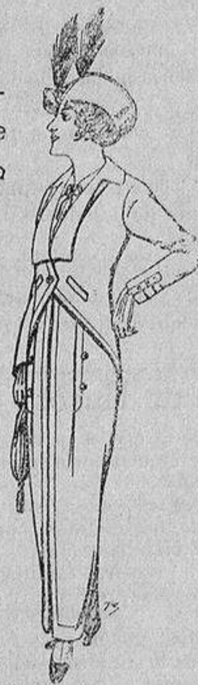
Trajes jerga negra para Señora 65 ptas.