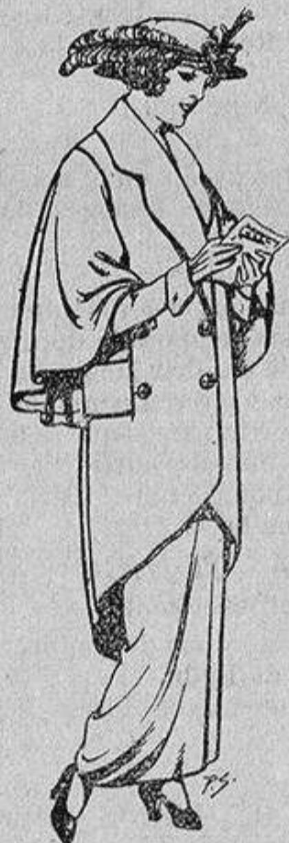
Abrigos de patén para Señora De 55 a 65 ptas.