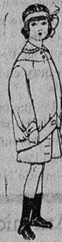
Trajes de lanilla para niños de 4 a 12 años De Ptas. 20 a 30