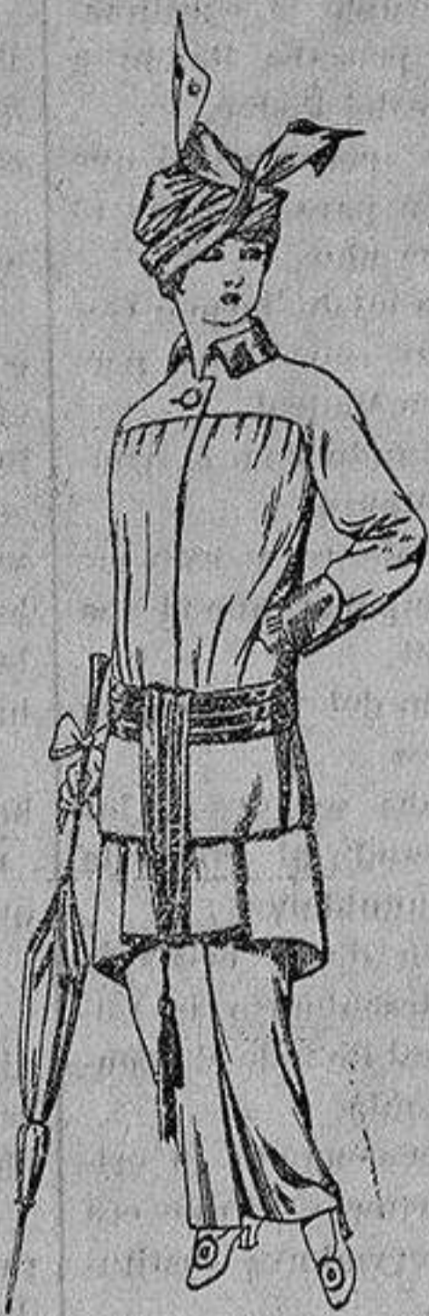
Traje de jerga azul o negra y géneros novedad, para señora De Ptas. 65 a 80