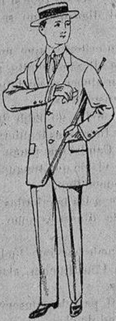
Trajes de nanilla vicuña, etc., para niños de 10 a 15 años De Ptas. 14 a 48