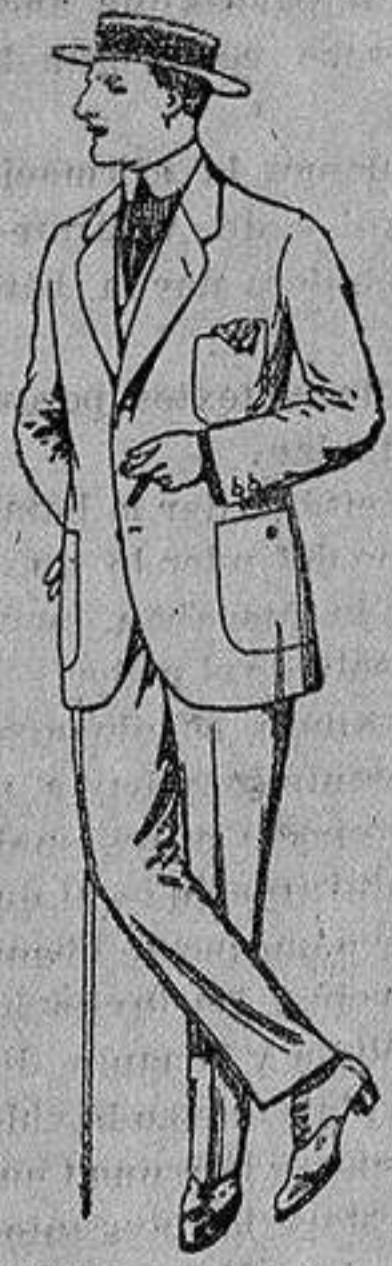
Trajes de dril crudo kaki o listado De Ptas. 10 a 32

Madrid, Barcelona, Alicante, Almería, Bilbao, Cádiz, Cartagena, Gijón, Granada, Málaga, Palma de Mallorca, Santander, - Sevilla, Valencia, Valladolid y Zaragoza -