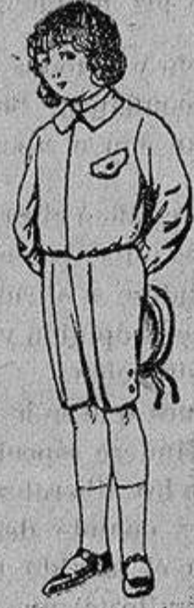
Trajes de lanilla, vicuña o jerga, para niños de 4 a 9 años De Ptas. 5 a 10