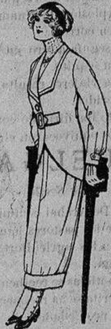
Trajes de lanilla para jovencitas de 13 a 16 años A Ptas. 27