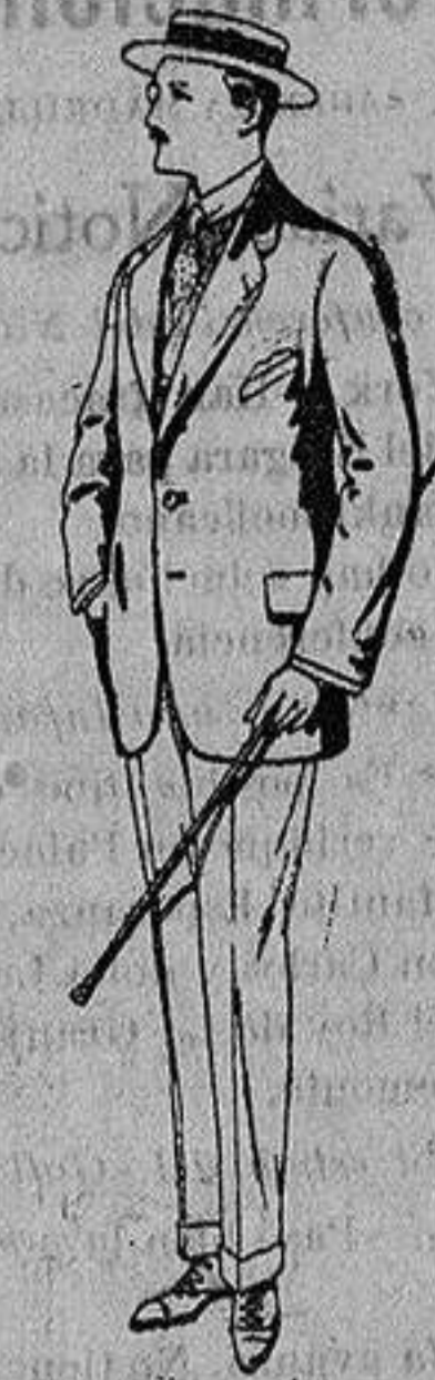
Trajes de alpaca uagra De Ptas. 32 a 56