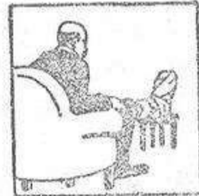
Gota - Dolores