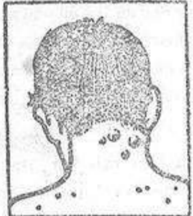
Granos - Forunculos