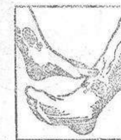
Males en las piernas

La sangre del artrítico está entorpecida por venenos que provienen de una insuficiencia de vitalidad y por consiguiente su circulación es del todo defectuosa. Las piernas del enfermo están hinchadas y entorpecidas con varices dolorosas con peligro de ruptura o de ulceración interminable. Con frecuencia el artrítico está atormentado con dolores reumáticos y reumáticos que le hacen achacoso y con el tiempo le agotan. Sus riñones están generalmente obstruidos con nefritis, albuminuria, arena en la orina (mal de piedra) y a veces fuertes dolores en la espalda. Las arterias duras y quebradizas como tubos de pipa (arterioesclerosis) amenazan a cada instante, accidente generalmente pronosticado con insomnios y dolores de cabeza. La mujer artrítica tiene erupciones irregulares o penosas y su edad crítica es un largo suplicio, con hinchazón de calor, vértigos, jaquecas, perturbación profunda, con frecuencia fibromas o tumores en el vientre. Los artríticos de ambos sexos tienen también enfermedades de la piel, como eczemas, herpes, sarpullidos, prurito, sordiditas, forunculos etc., con lesiones molestas y con frecuencia interminables. Todos estos enfermos de la sangre, todas estas víctimas martirizadas del artrítico no tienen que desesperarse y creerse incurables pues e-