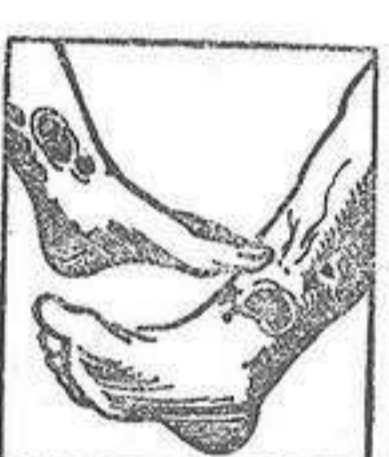
Males en las piernas

La sangre del artrítico está entorpecida por venenos que provienen de una insuficiencia de vitalidad y por consiguiente, su circulación es del todo defectuosa. Las piernas del enfermo están hinchadas y entorpecidas con varices dolorosas con peligro de ruptura o de ulceración interminable. Con frecuencia el artrítico está atormentado con dolores gotosos o reumáticos que le hacen achacosos y con el tiempo lo agotan. Sus riñones están generalmente obstruidos con nefritis, albuminuria; arena en la orina (mal de piedra) y a veces fuertes dolores en la espalda. Las arterias duras y quebradizas como tubos de pipa (arteriosclerosis) amenazan a cada instante, accidente generalmente pronosticado con insomnios y dolores de cabeza. La mujer artrítica tiene épocas irregulares o penosas y su edad crítica es un largo suplicio, con bocanadas de calor, vertigos, jaquecas, postración profunda, con frecuencia fibromas o tumores en el vientre. Los artríticos de ambos sexos tienen también enfermedades de la piel, acné, eczemas, herpes, sarpullidos, prurigo, sifiliasis, forunculosis etc., con lesiones molestas y conexas intolerables. Todos esos enfermos de la sangre, todas esas víctimas martirizadas del artritis no no tienen que desesperarse y creerse incurables pues el