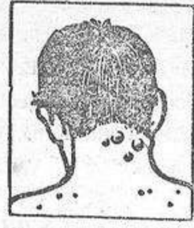
Granos - Forunculosis