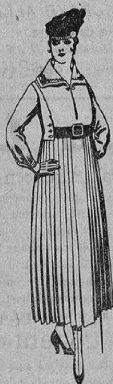
Vestidos de sarga inglesa en negro, azul y color, cuello bordado, cinturón de charol, de ptas. 68 a 75.