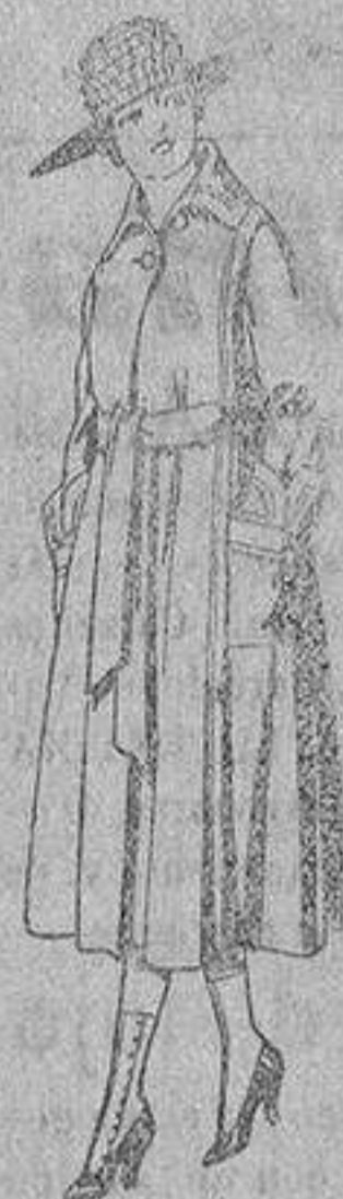
Abrigos de gamuza, ratina, etc., color, para jovencitas de 12 a 15 años, de ptas. 40 a 48.