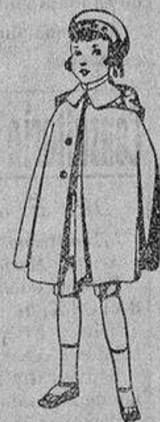
Capas de vicuña azul, para niños de 4 a 9 años, de pesetas 9 a 22.