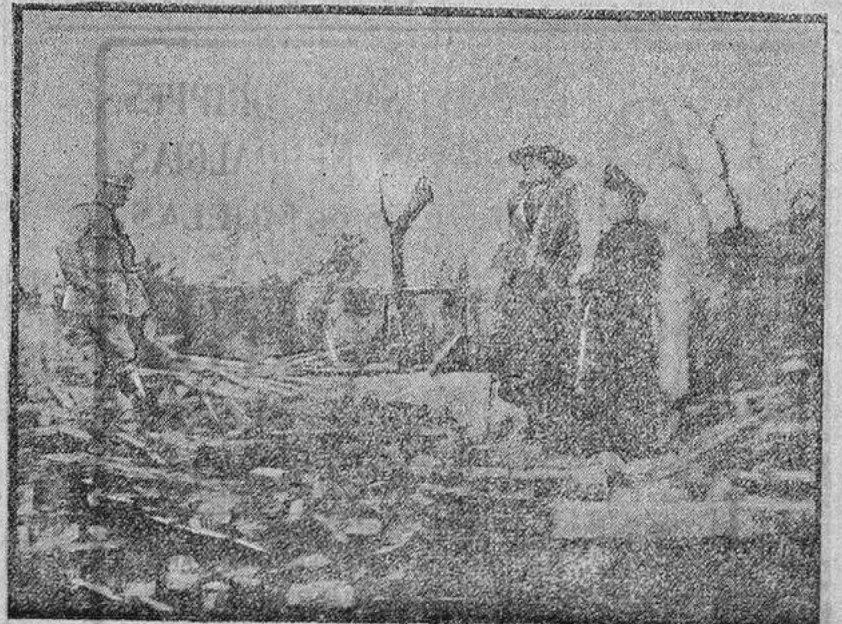
Evacuados regresando a su país y visitando las ruinas de sus casas