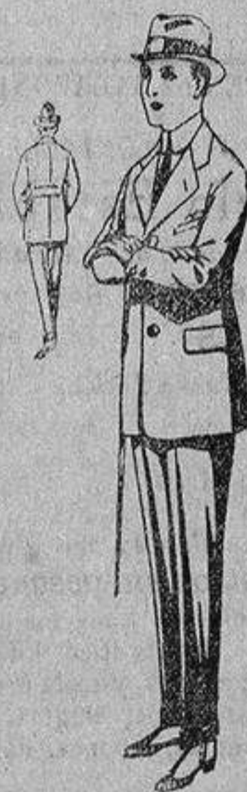
Trajes de patén, vicuña, etc., forma Sport, para niños de 10 a 12 años, de ptas. 19 a 45. Los mismos, para jovencitos de 13 a 16 años, de ptas. 21 a 48.