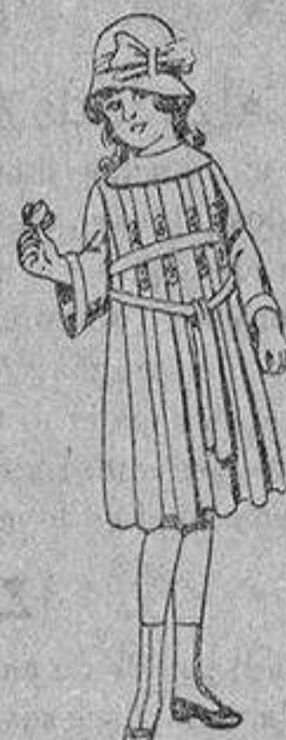
Vestidos de estambre azul bordado, para niñas de 4 a 9 años, de ptas. 30 a 38.