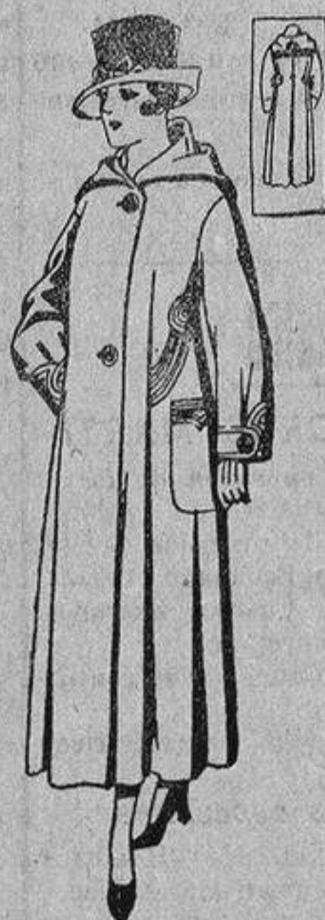
Abrigos de gamuza, patén, etc. y color, de pesetas, 55 a 65.

Ultimas novedades en echarpes, manguitos pelerinas, corbatas, abrigos, etc., en pieles de loure, taupe, vison, renard, zibeline, armiño, etc., auténticas é imitación perfecta.