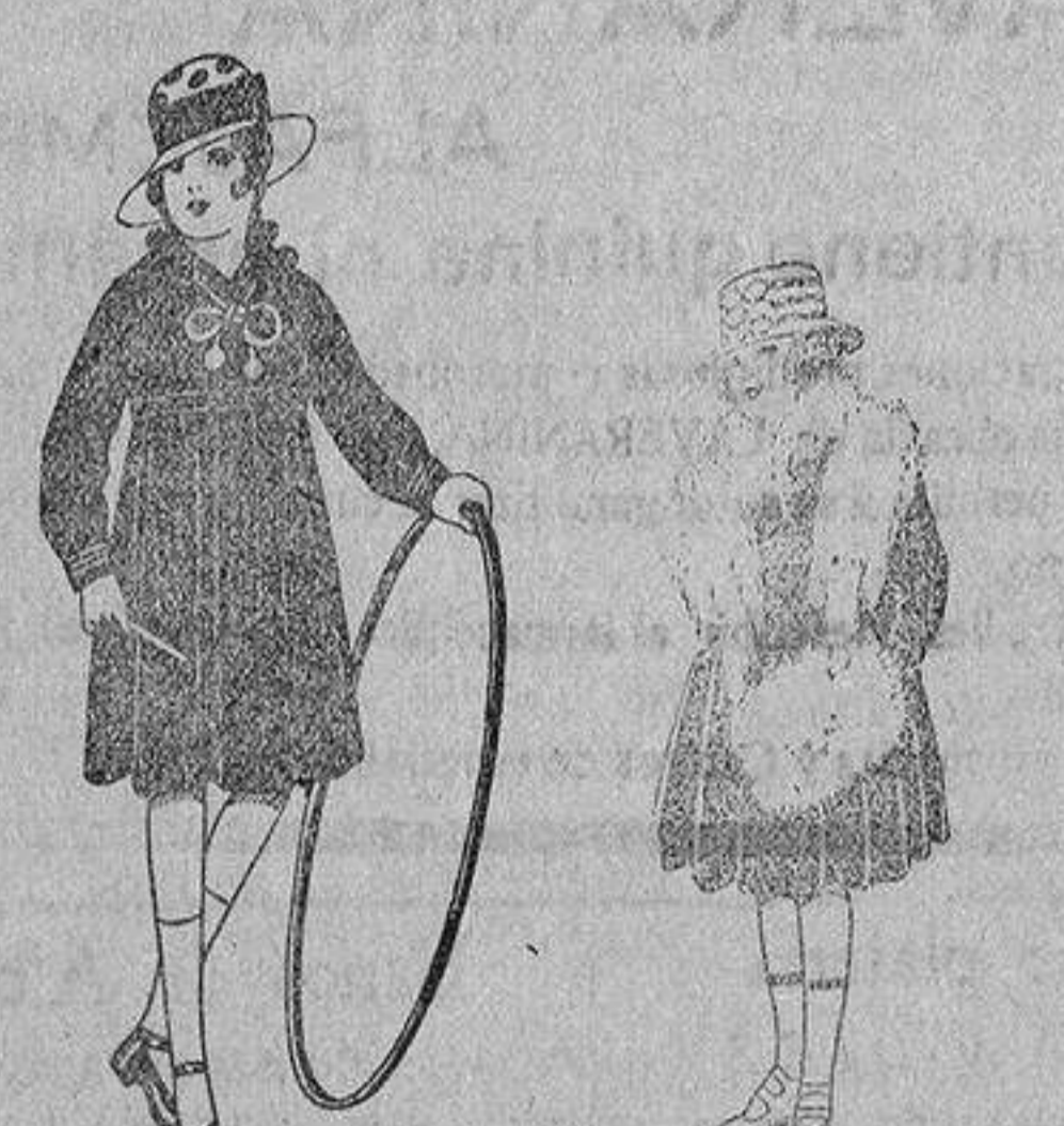
Vestidos marinera, de sarga o estambre azul, adornos seda blancos, de ptas. 25 a 50.