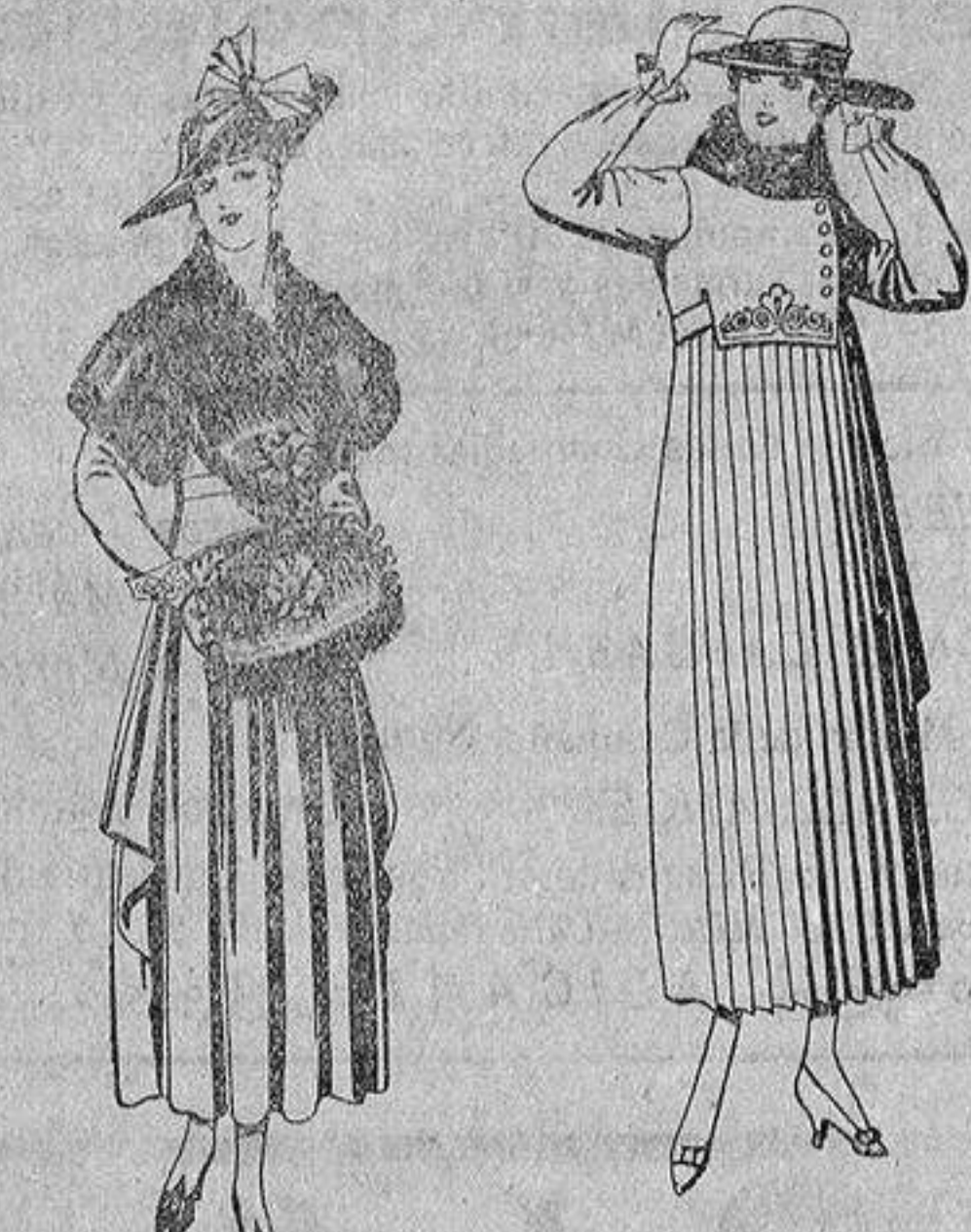
Juegos de pieles, negro, imitación Renard. Gran chic, a ptas. 58.

Madrid, Barcelona, Alicante, Almería, Bilbao, Cádiz, Cartagena, Gijón, Granada, Málaga, Palma de Mallorca, Santander, Sevilla, Valencia, Valladolid y Zaragoza.