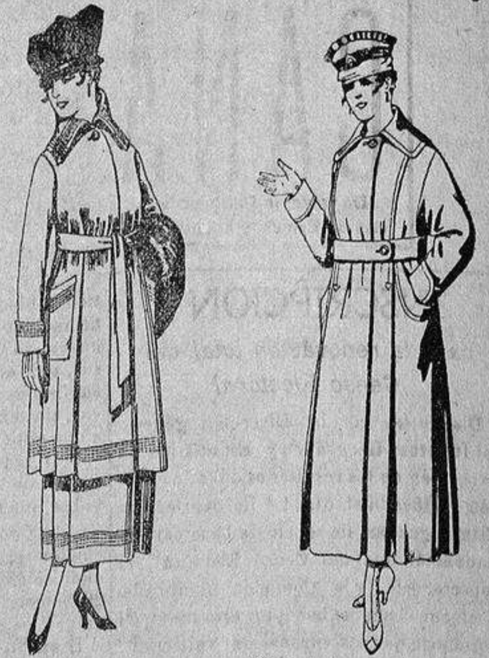
Trajes de sarga inglesa, en negro y azul, bordados, de ptas. 85 a 100.