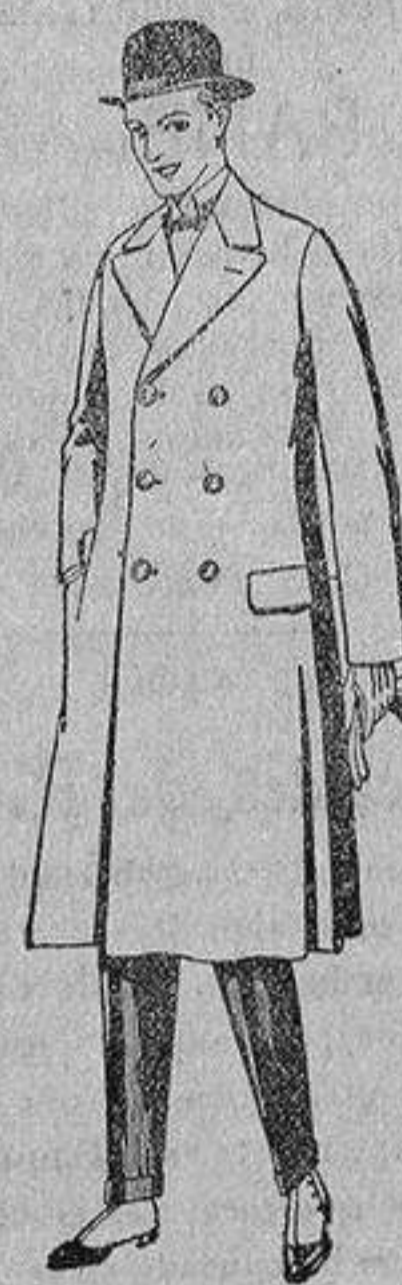
Gabanes de patén gamuza o Cowar, de pesetas 50 a 110.