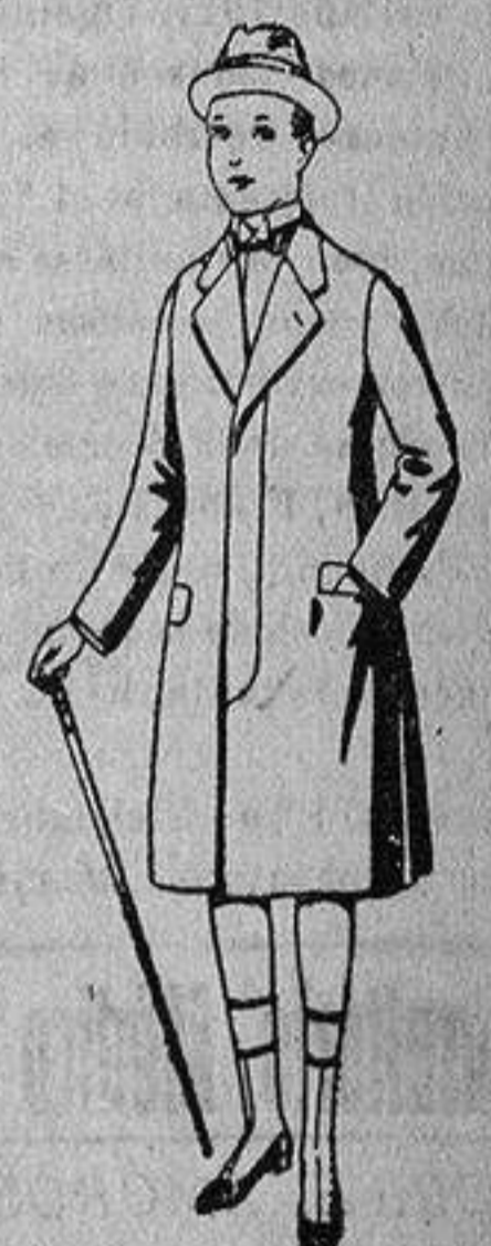
Gabanes de patén para niños de 10 de a 12 años, de ptas. 18 a 55. Los mismos, para jovencitos de 13 a 16 años de ptas. 21 a 58.

PRECIO FIJO - VENTAS AL CONTADO - Pídase el Catálogo general