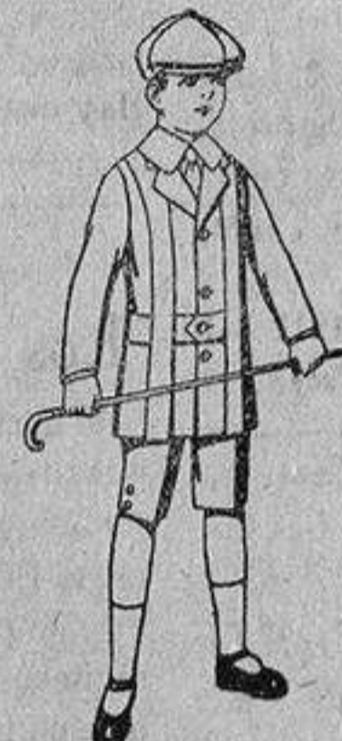
Trajes de patén, modelo «Norfolk», para niños de 4 a 9 años, de ptas. 14 a 35.