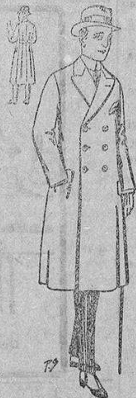
Abrigos de patén ó gamuza, con cinturón de ptas. 50 a 110