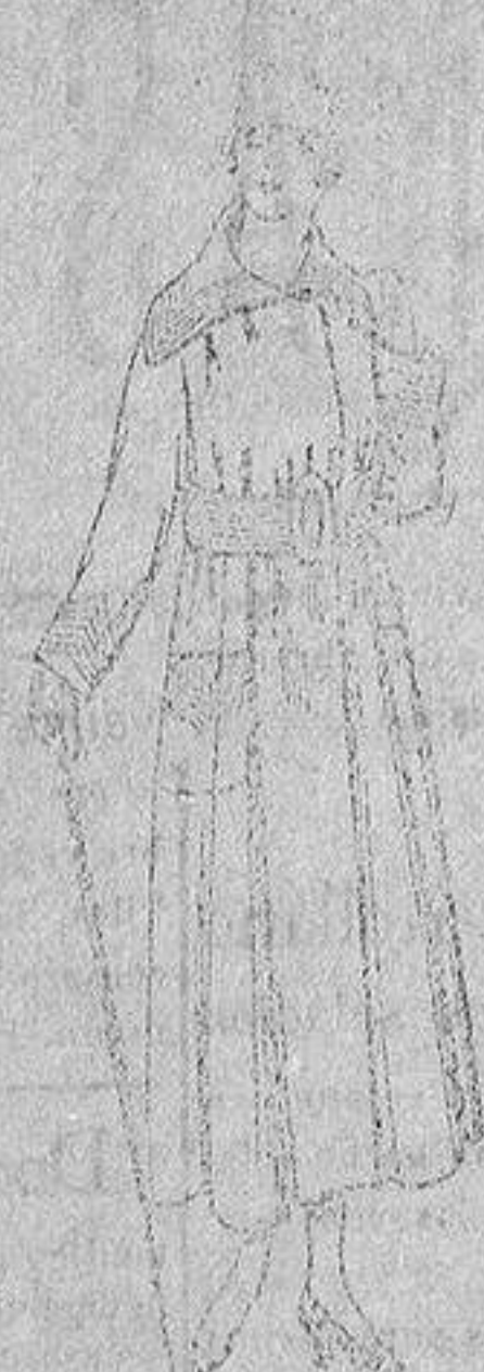
Abrigos de cheviot, etcétera, de ptas. 50 a 60