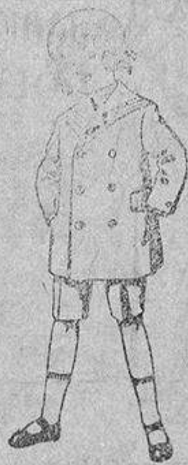
Trajes modelo «Mafelot» de vicuña ó jerga azul, para niños de 4 a 9 años, de peso 14 a 34.