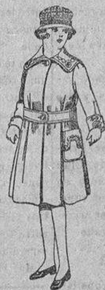
Abrigos de cheviot, pañete, etc., color, bordados, para niñas de 4 a 6 años, de ptas. 24 a 28.