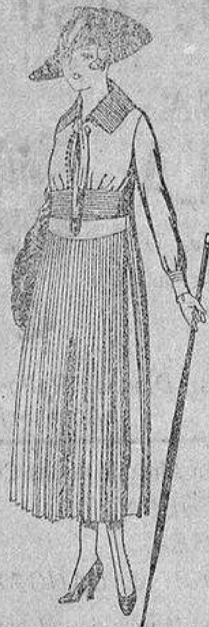
Vestidos de surta inglesa, en negro azul y color, corbata de punto, de ptas. 72 a 85.