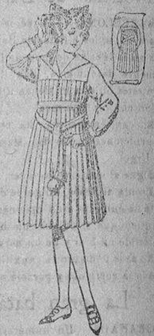
Vestidos de estambre, azul y color, adornos bordados, para jovencitas de 12 a 15 años, de ptas. 46 a 50.

PRECIO FIJO - VENTAS AL CONTADO - Pídase el Catálogo general