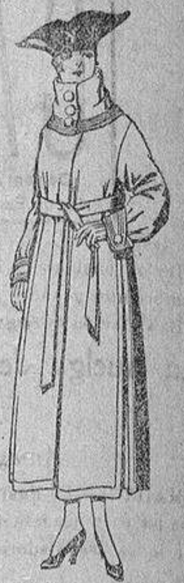
Abrigos de pañete, colores azul, beige y café, de ptas. 65 a 85.