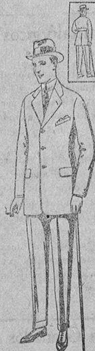
Trajes de cheviot, corte elegante, para sportman, de ptas. 45 a 67

Gamiseria - Géneros de punto Gorbatería - Guantería Sombrerería - Zapatería Paraguas - Bastones y artículos de viaje