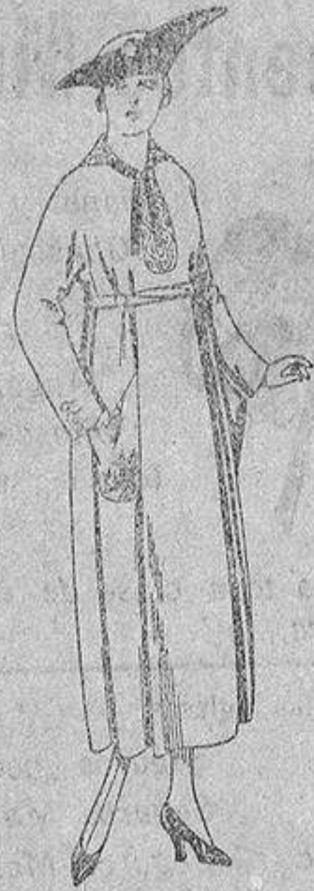
Vestidos de g. bardina, estambre etc., en color azul bordados, de ptas. 53 a 60. Los mismos, en punto de lana «ljer» bordados, de ptas. 93 a 112.

Madrid, Barcelona, Alicante, Almería, Bilbao, Cádiz, Cartagena, Gijón, Granada, Málaga, Palma de Mallorca, Santander, Sevilla, Valencia, Valladolid y Zaragoza.