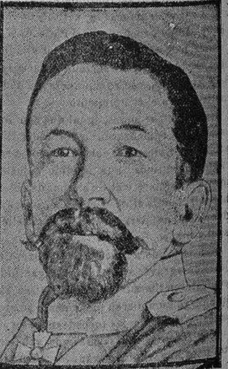
El general Korniloff