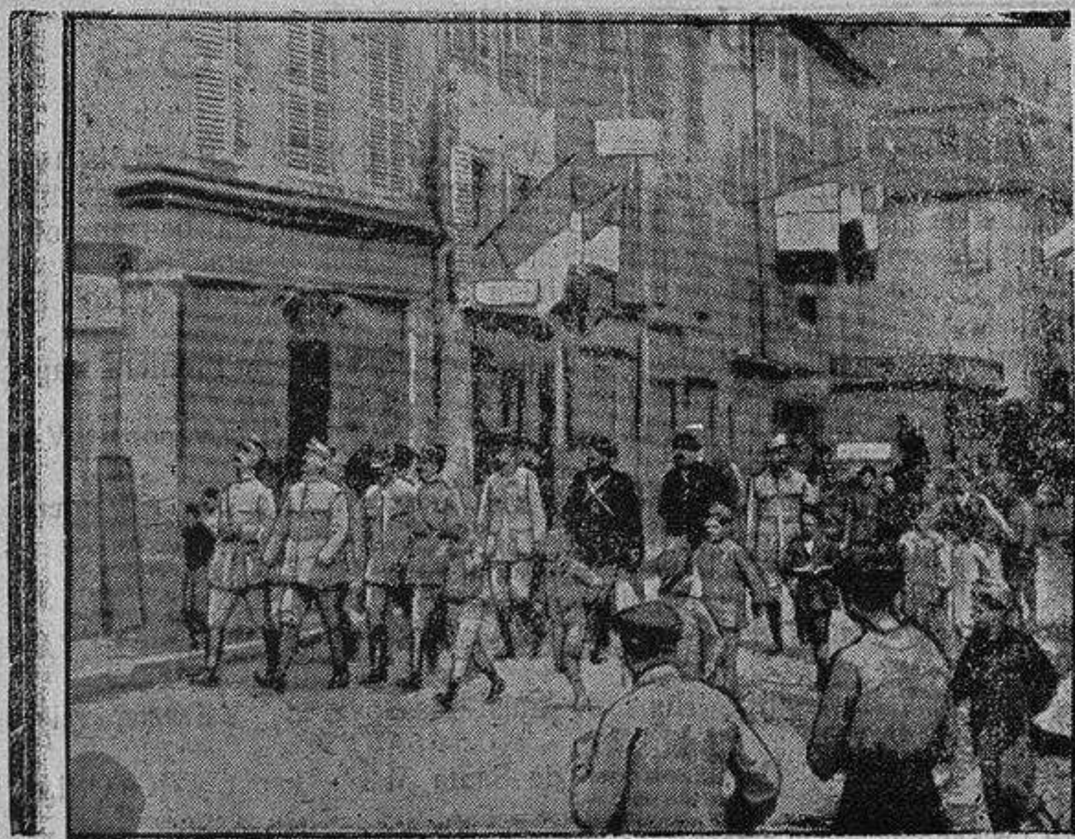
El general Petain visitando la ciudad de Thann