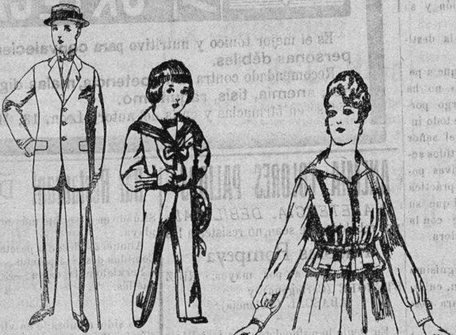
Trajes de lanilla, vicuña, etc., para jovencitos de 10 a 17 años. De ptas. 17 a 50.