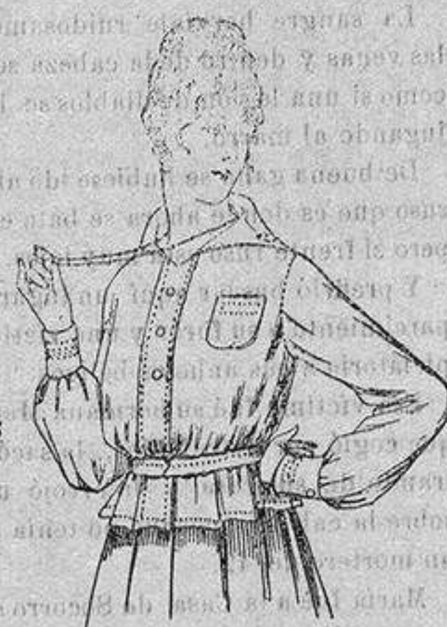
Blusa batista blanca, cuello con calados. A ptas. 4'50.