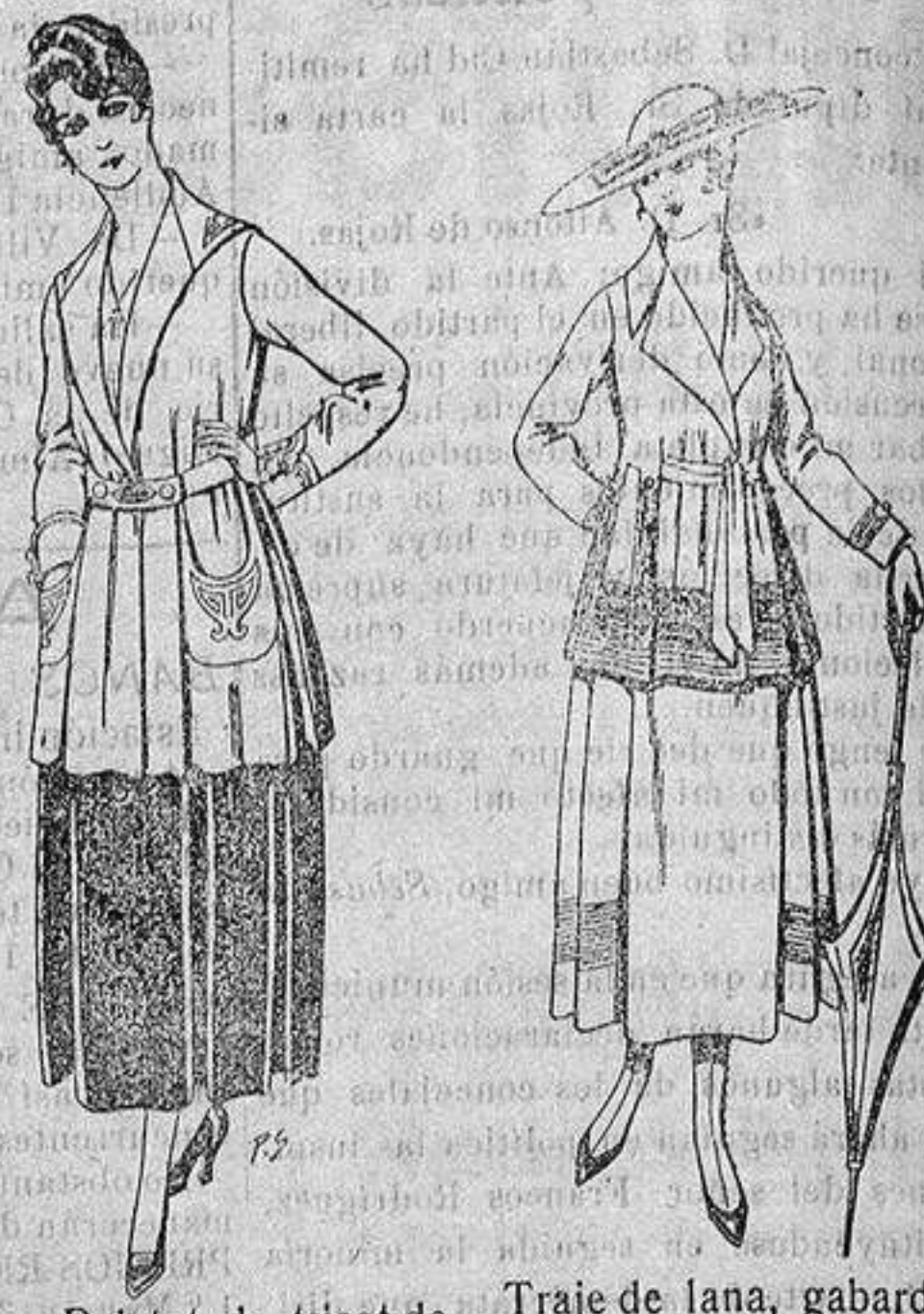
Paletot de tricot de seda o lana. De ptas. 14 a 57.