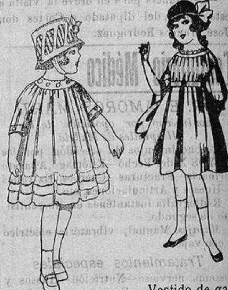
Vestidos de voile blanco, con bordados. De ptas. 7 a 10.