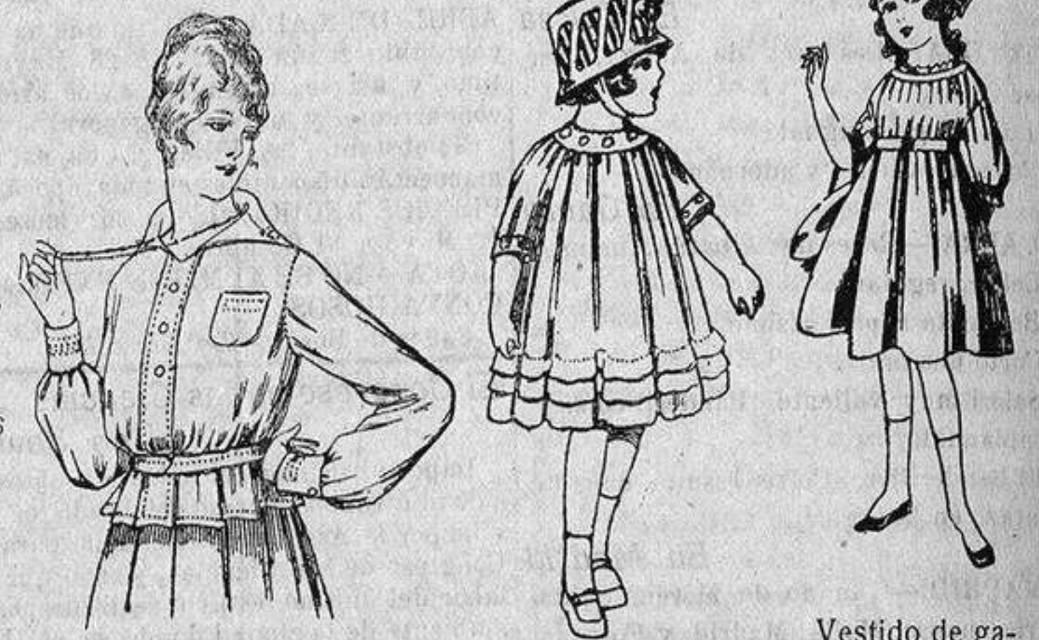
Blusa batista blanca, cuello con calados. A ptas. 4'50. Vestidos de voile blanco, con bordados. De ptas. 7 a 10. Vestido de gabardina blanca, azul y colores. De ptas. 18 a 25.

Gamisería, Géneros de Punto, Corbatería, Guantería, Sombrerería, Zapatería, Bastones, Paraguas y Artículos de Viaje