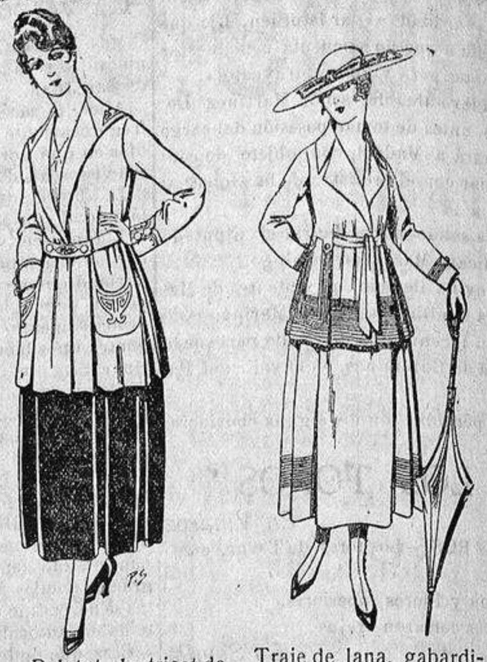
Paletot de tricot de seda o lana. De ptas. 14 a 57. Traje de lana, gabardina negra, azul y color, diferentes bordados. De ptas. 8'50 a 90.