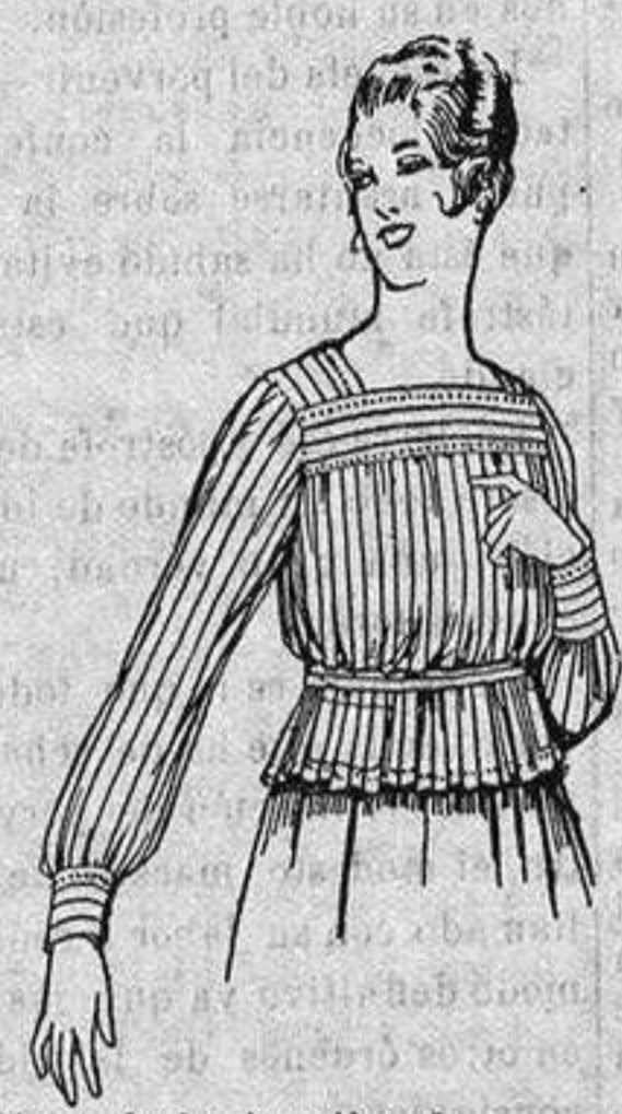
Blusa de batista listada. De ptas. 4'50.

Ropas confeccionadas para Caballero Señora, Niño y Niña