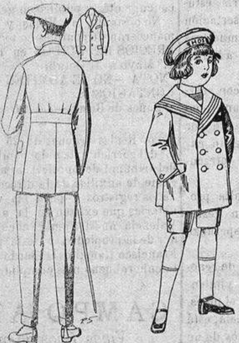
Traje modelo sport, de lanilla, melton, etc., para jovencitos de 10 a 16 años. De ptas. 27 a 52 Los mismos en dril. De ptas. 11 a 21 Traje matelot de vicuña o jerga azul para niños de 4 a 9 años. De ptas. 14 a 32