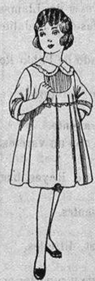
Vestido de lanilla azul, con bordos, para niñas de 4 a 9 años. De ptas. 22 a 28.