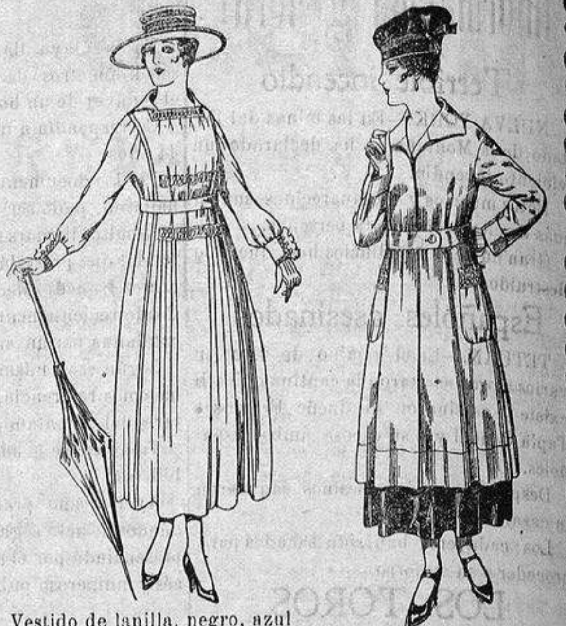
Vestido de lanilla, negro, azul y color. De ptas. 60 a 70 Abrigo de tricot de lana colores lisos. De ptas. 63 a 75

Madrid, Barcelona, Alicante, Almería, Bilbao, Cádiz, Cartagena, Gijón, Granada, Málaga, Palma de Mallorca, Santander, Sevilla, Valencia, Valladolid y Zaragoza.