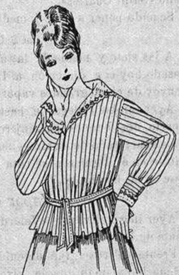
Blusa voile listada, cuello organdín bordado. De ptas. 9'50

Gamisería, Gúneros de Punto, Corbatería, Guantería, Sombrerería, Zapatería, Bastones, Paraguas y Artículos de Viaje