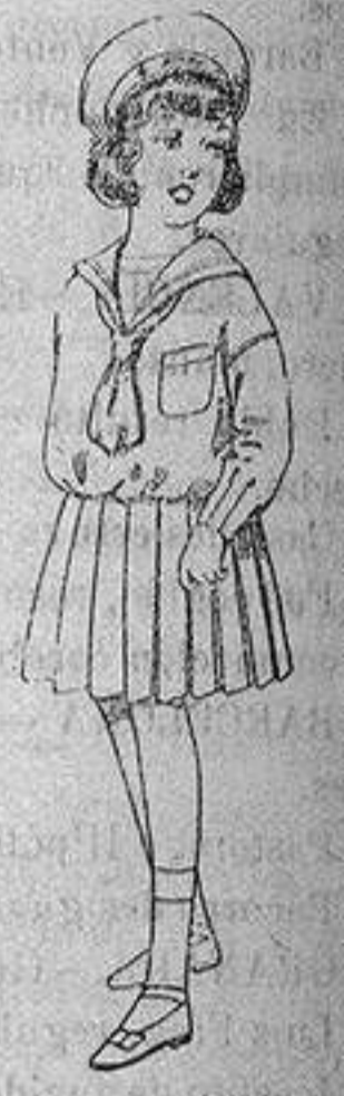
Trajes marinera, de lanilla azul, para niñas de 4 a 9 años. Ptas. 32 a 38