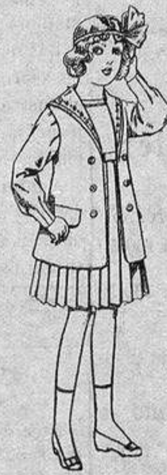
Traje de gabardina blanco, cuello de organdín bordado, para niñas de 4 a 9 años. De ptas. 22 a 24