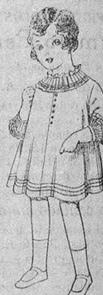
Vestido de voile blanco bordado. De ptas. 6'75 a 8