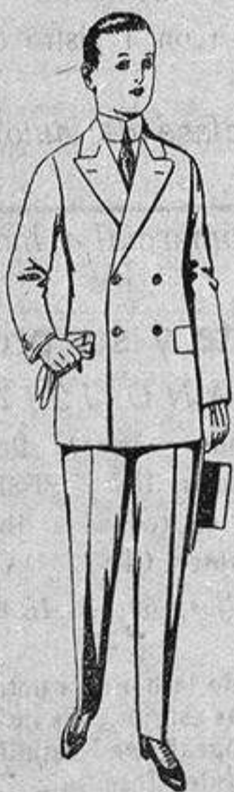
Traje de estambre, vicuña o jerga para jovencitos de 10 a 16 años. de ptas. 19 a 50