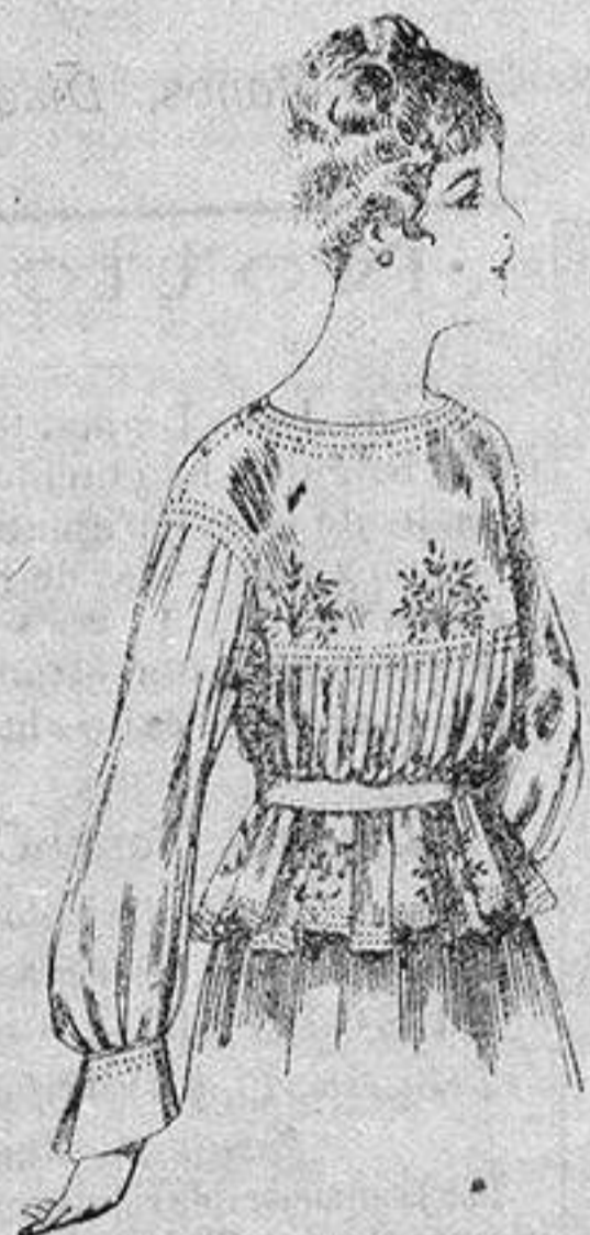
Blusa de crespón o seda, en negro, azul y color. de ptas. 33 a 35

Ropas confeccionadas para Caballero Señora, Niño y Niña