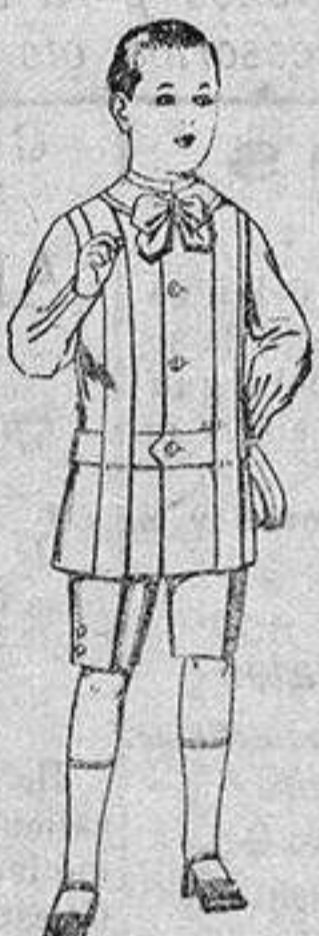
Traje de lanilla, para niños de 4 a 9 años. de ptas. 12 a 31