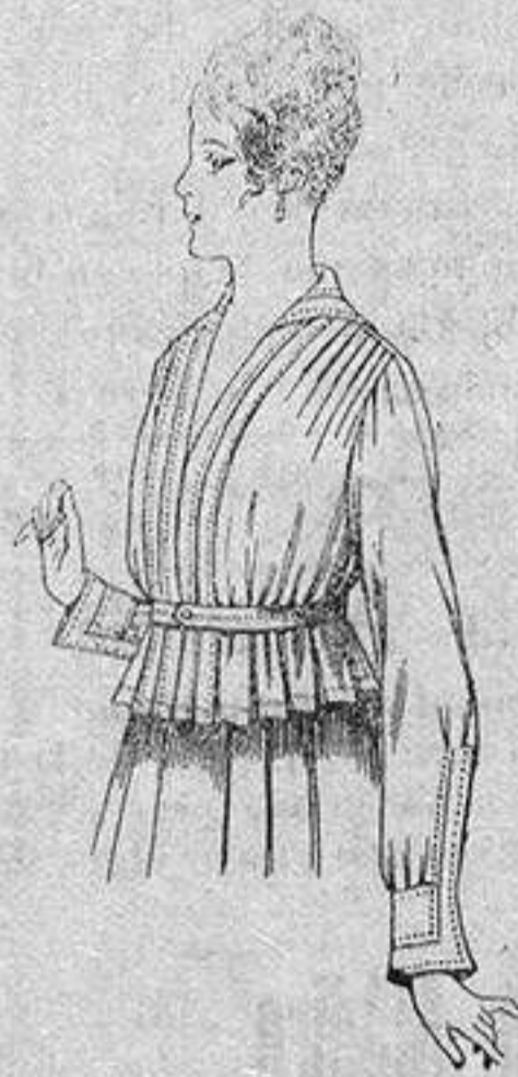
Blusa batista blanca A ptas. 5'75

Gamisería, Géneros de Punto, Corbatería, Guantería, Sombrerería, Zapatería, Bastones, Paraguas y Artículos de Viaje