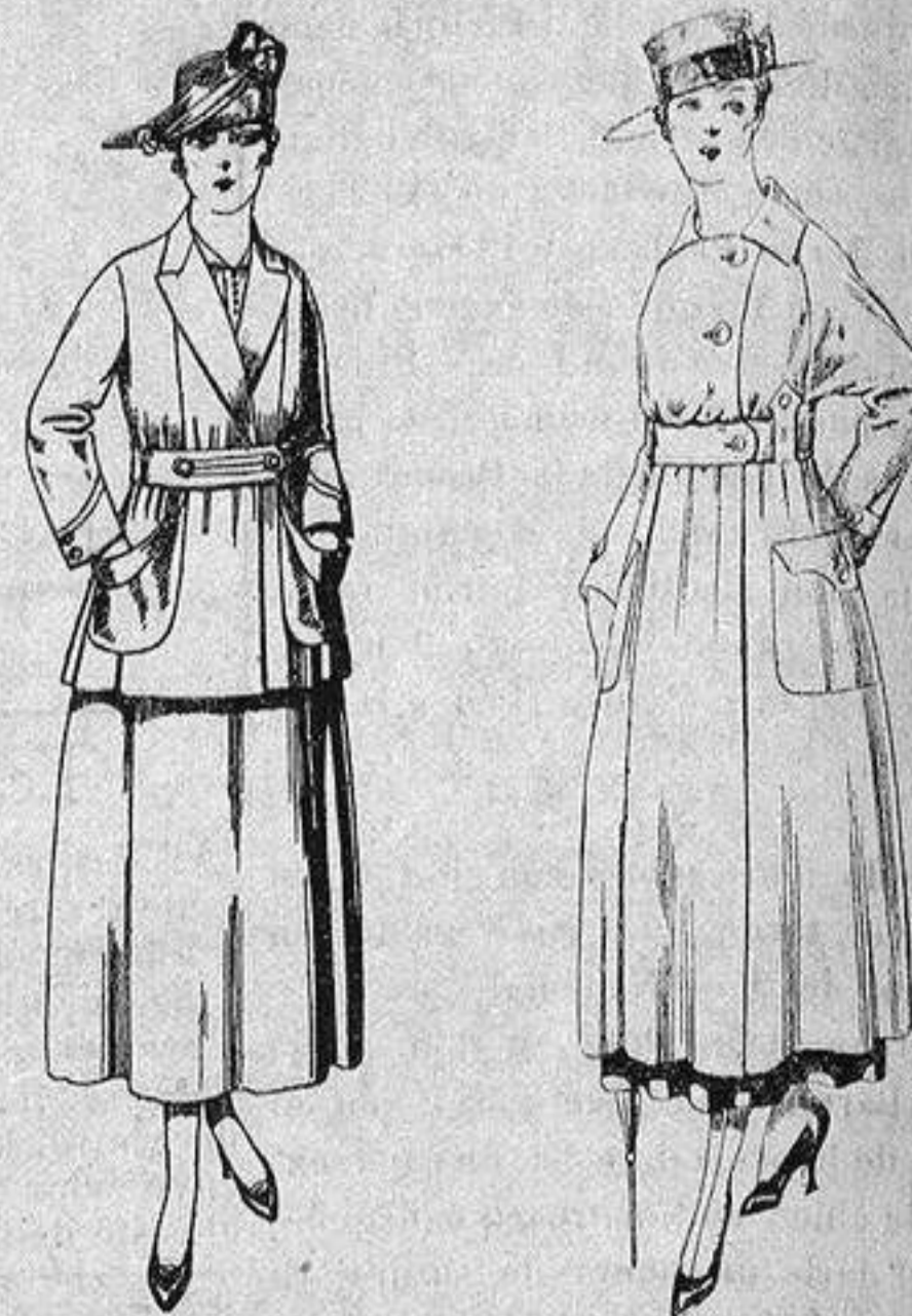
Traje de estambre negro, azul y color. de ptas. 70 a 75