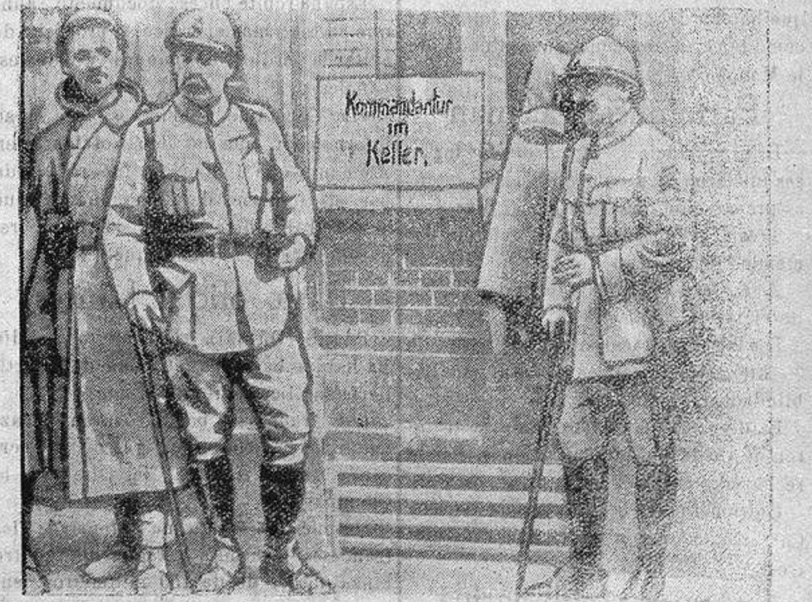
Casa donde estuvieron instaladas las oficinas de la Kommandantur alemana en Royá

Y esta falta de equanimidad en la conducta de la diosa de los favores es precisamente lo que nos hace adorarla más, viendo en ella a la novia coqueta que va por la calle mirando a todos los transeúntes y poniéndonos en evidente caso de ridiculez. Y así como amamos más a la novia cuanto más coqueta sea, cuanto más frágil nos parezca su constancia, así a la fortuna la deseamos más cuanto más intermitente sean sus favores. Estoy seguro de que si en el mundo —aparte del famoso señor que no usaba camisa— hubiese algún hombre completamente feliz, pronto se cansaría de serlo y buscaría algún disgusto para romper la enervante monotonía de su felicidad.