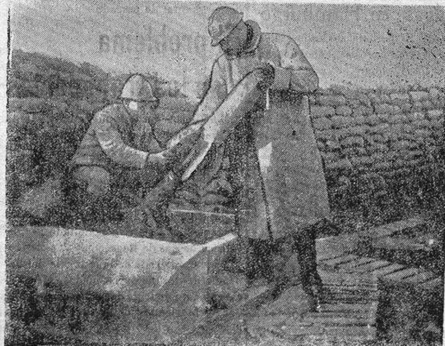
DISPARANDO UN TORPEDO AÉREC