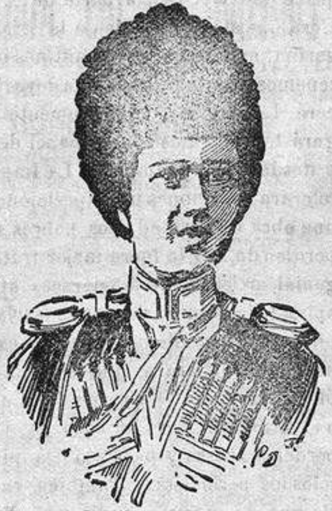
El zarévitch Alexis Nicolai-ovitch, primogénito del zar depuesto

La regencia del Imperio ha sido recomendada por el Comité revolucionario al hermano del Emperador, el Gran Duque Miguel Alexandrovitch, que cuenta treint