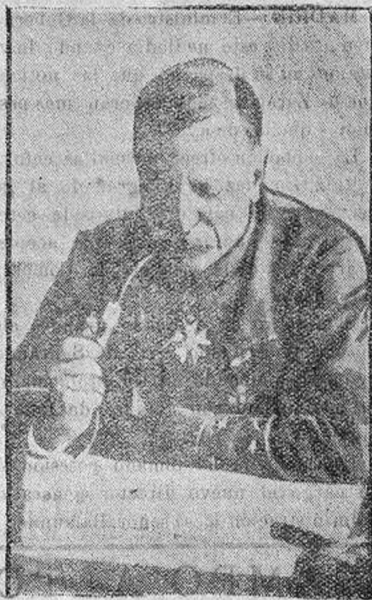
El general Maudhuy