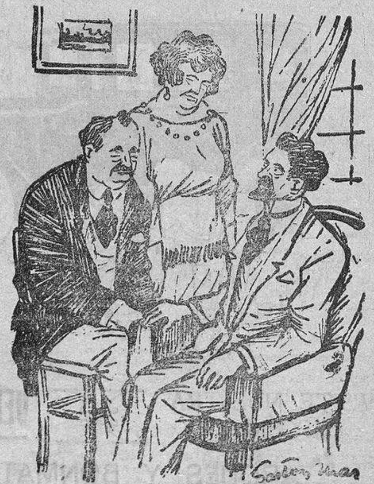
Mejor que el bachillerato...

--Pues yo vengo a dar a ustedes cuenta, de que su chico se empeña en no estudiar. --Tan aprovechadito que era... --Pues ahora dice que quiere seguir la misma carrera que el «Meló».