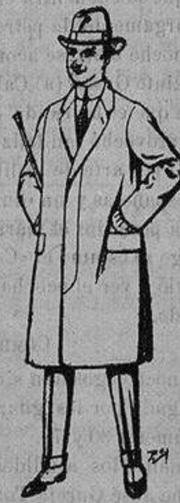
Gabanes de lana vigonia o melton, para niños de 10 a 16 años.