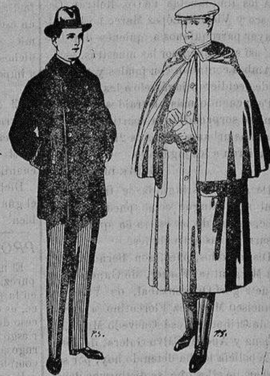
Pellizas con cuello y bocamangas astrakan. De 14 a 90 ptas.