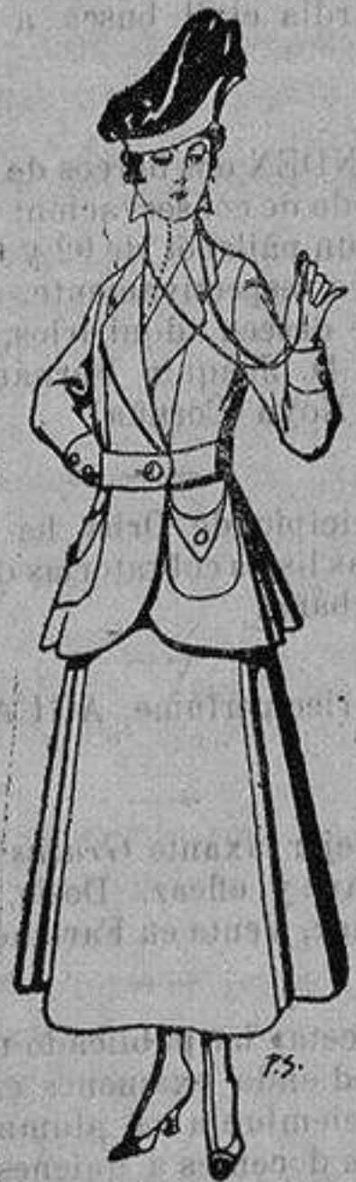
Trajes de lana negra, azul y color, para señora. De ptas. 50 a 55