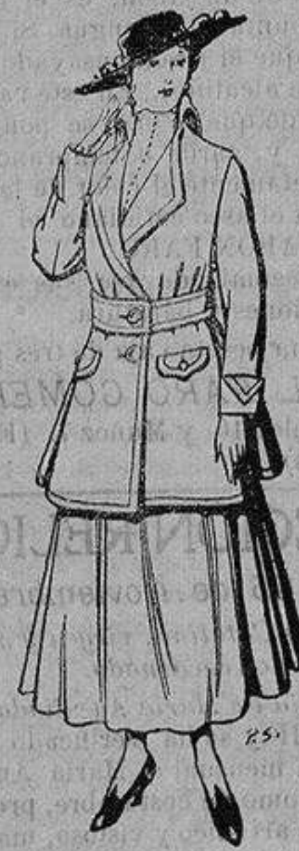
Abrigos de patén gran novedad para señora. De 26 a 40 ptas.