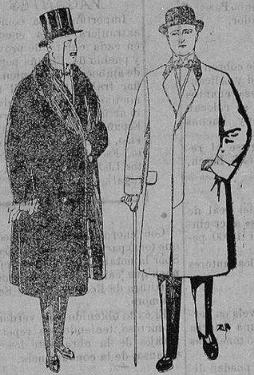
Gabanes de edredón negro, forro seda, cuello y vistas de piel. De 125 y 135 ptas

Madrid, Barcelona, Alicante, Almería, Bilbao, Cádiz, Cartagena, Gijón, Granada, Málaga, Palma de Mallorca, Santander, Sevilla, Valencia, Valladolid y Zaragoza