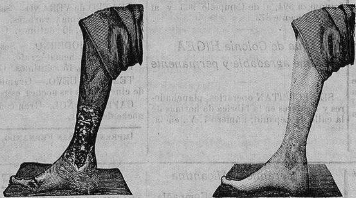
Antes de la curacion