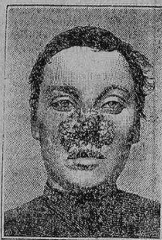
Antes de la curacion