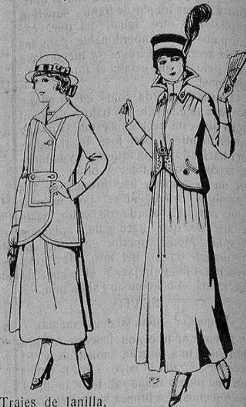
Trajes de lanilla, para jovencitas de de 13 a 15 años De ptas. 27 a 30 Trajes de lana negra, azul, para señora A 55 ptas.