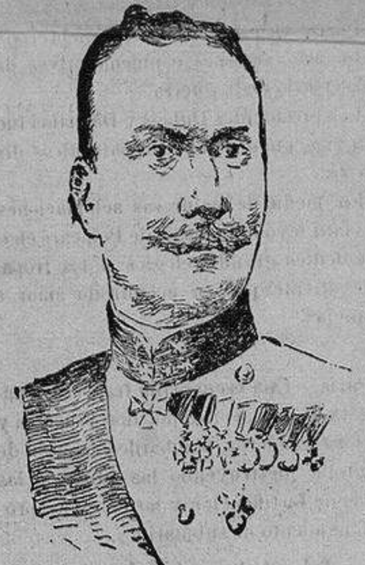
General BARON VON CZIBULKA comandante de uno de los cuerpos de ejército húngaros que operan en la Galitzia Oriental