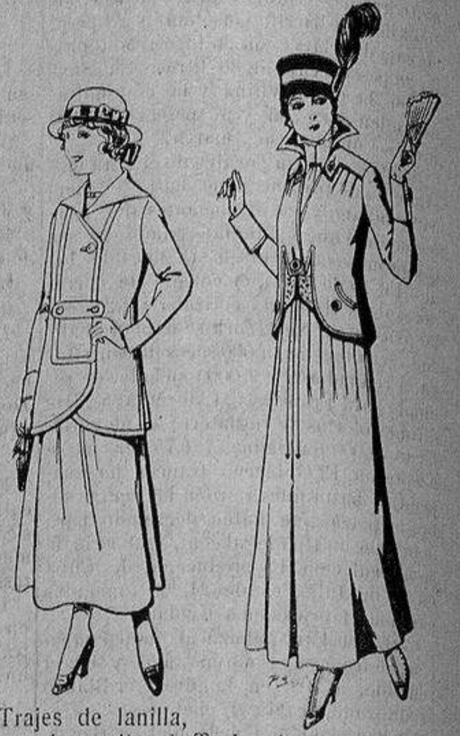
Trajes de lanilla, para jovencitas de 13 a 15 años De ptas. 27 a 30 Trajes de lana negra, azul, para señora A 55 ptas.