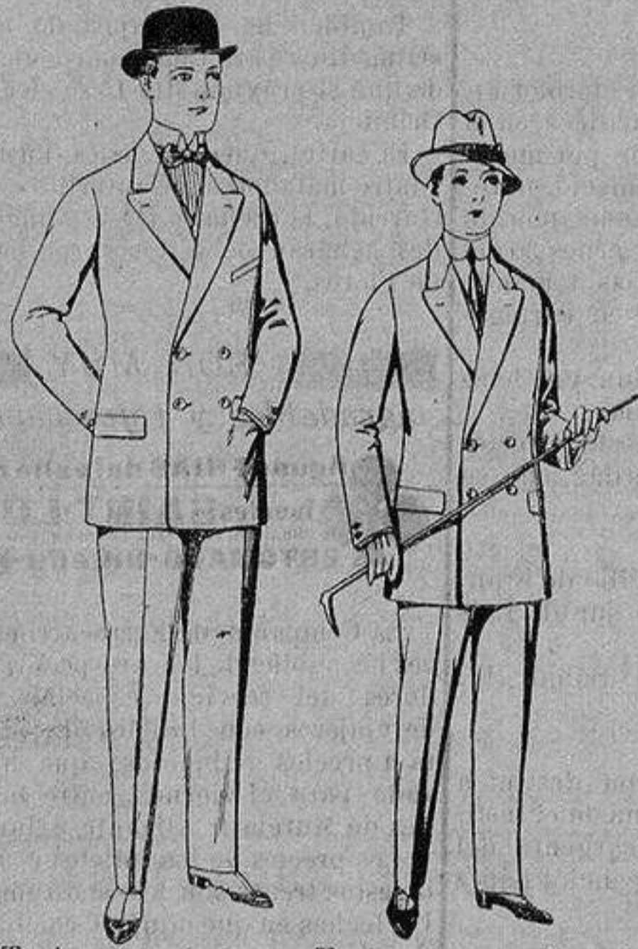
Trajes de vicuña o Trajes de estambre, vi- jerga, negros y azules cuña o jerga, para ni- ños de 10 a 16 años De ptas. 17 a 48 De ptas. 32 a 73

Madrid * Barcelona * Almería * Bilbao * Cádiz Cartagena * Gijón * Granada * Málaga * Pal- ma de Mallorca * Santander * Sevilla * Valencia Valladolid y Zaragoza