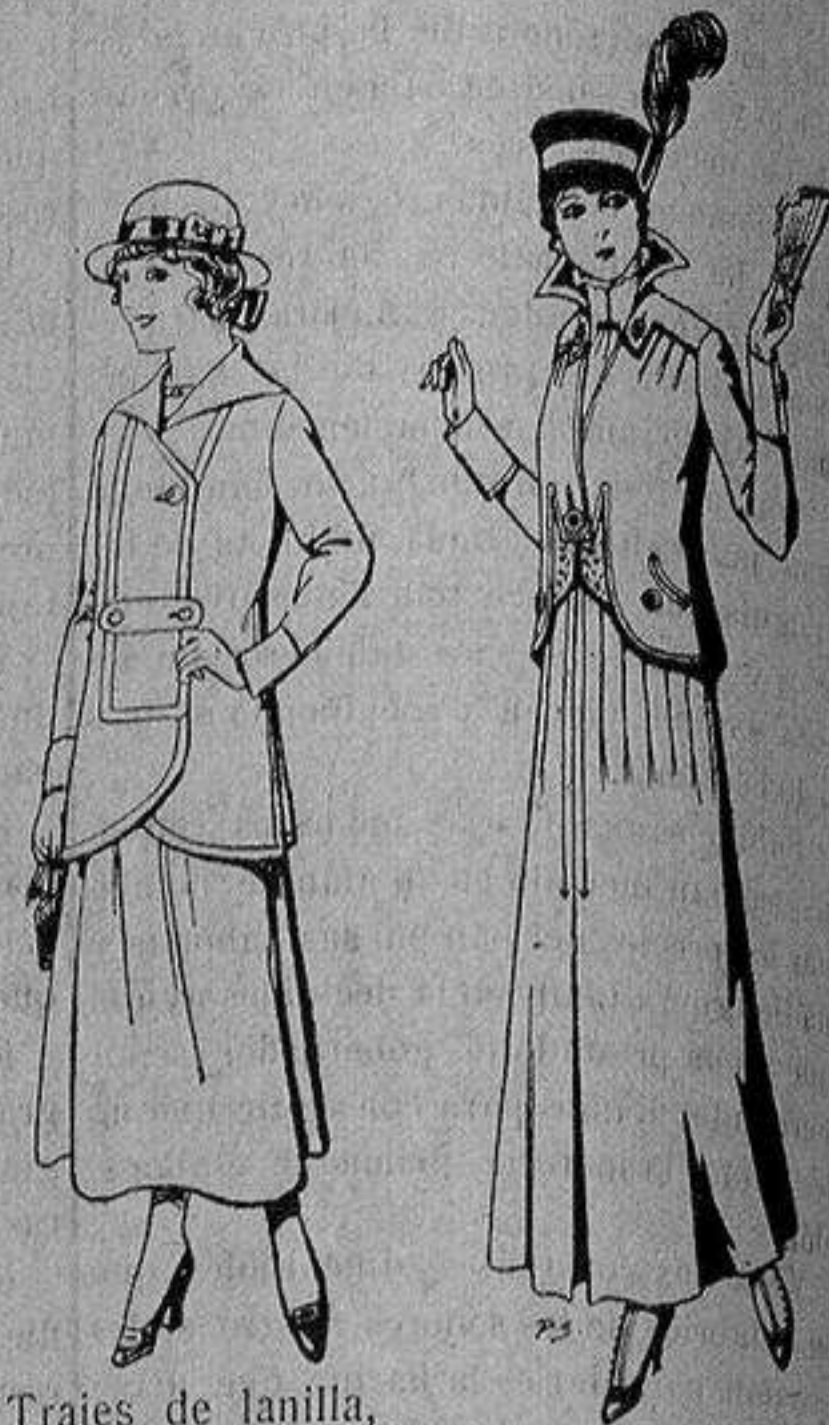
Trajes de lanilla, para jovencitas de 13 a 15 años De ptas. 27 a 30 Trajes de lana negra, azul, para señora A 55 ptas.