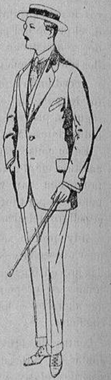
Trajes de alpaca negra De ptas. 32 a 56