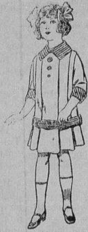
Vestidos de dril para niñas de 4 a 12 años De ptas. 5 a 12