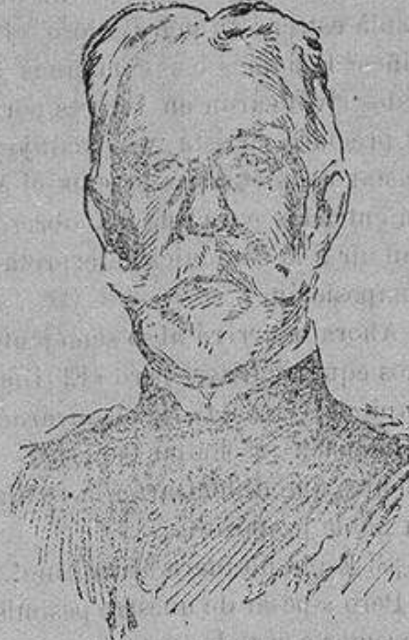
General OROZCO, nuevo capitán general de Madrid