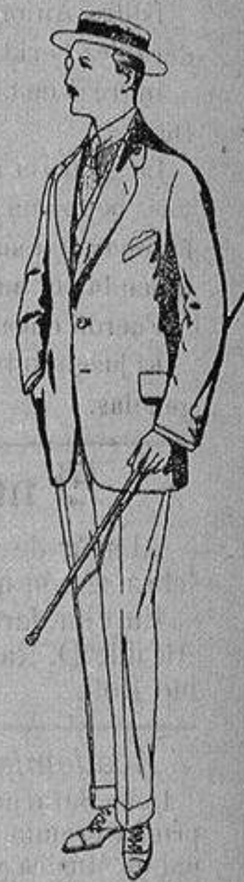
Trajes de alpaca negra De ptas. 32 a 56