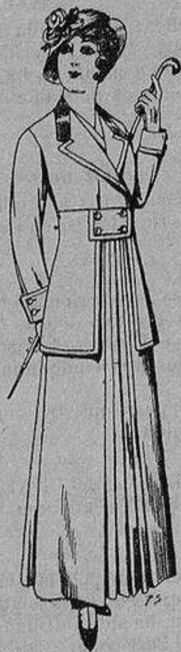
Trajes de lana ne- gra azul y color pa- ra señora A ptas. 70

Madrid * Barcelona * Almería * Bilbao * Cádiz Cartagena * Gijón * Granada * Málaga * Pal- ma de Mallorca * Santander * Sevilla * Valencia Valladolid y Zaragoza