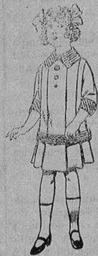
Vestidos de dril para niñas de 4 a 12 años De ptas. 5 a 12